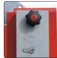
▲ Schlosskasten mit Profilhalbzylinderschloss und Blind-PZ-Einsatz (siehe Zubehör)