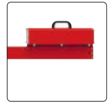
▲ Detail: Gegengewicht