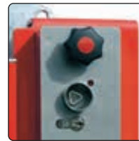
▲ Schlosskasten mit Feuerwehdreikant und Profilhalbzylinder für Hauptstütze

Befestigungsart: Zum Einbetonieren, empfohlenes Fundament der Hauptstütze L x B x H 600 x 600 x 800 mm, empfohlenes Fundament der Auflagestütze L x B x H 400 x 400 x 600 mm bzw. zum Aufdübeln bei +/- 0 mm mit Fußplatte (Hauptstütze L x B 400 x 270 mm, Auflagestütze L x B 200 x 200 mm). Befestigungsmaterial siehe Zubehör.