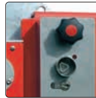
▲ Schlosskasten mit Feuerwehdreikant und Profilhalbzylinder für Hauptstütze

Befestigungsart: Zum Einbetonieren, empfohlenes Fundament der Hauptstütze L x B x H 600 x 600 x 800 mm, empfohlenes Fundament der Auflagestelle L x B x H 400 x 400 x 600 mm bzw. zum Aufdübeln bei +/- 0 mm mit Fußplatte (Hauptstütze L x B 400 x 270 mm, Auflagestelle L x B 200 x 200 mm). Befestigungsmaterial siehe Zubehör.