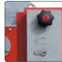
▲ Schlosskasten mit Profilhalbzylinderschloss und Blind-PZ-Einsatz (siehe Zubehör)