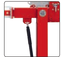
▲ Detail: Gasdruckfeder