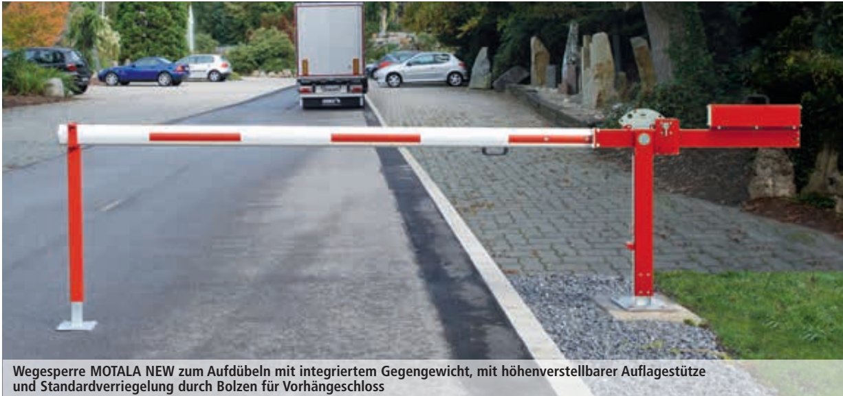
Wegesperre MOTALA NEW zum Aufdübeln mit integriertem Gegengewicht, mit höhenverstellbarer Auflagestelle und Standardverriegelung durch Bolzen für Vorhängeschloss