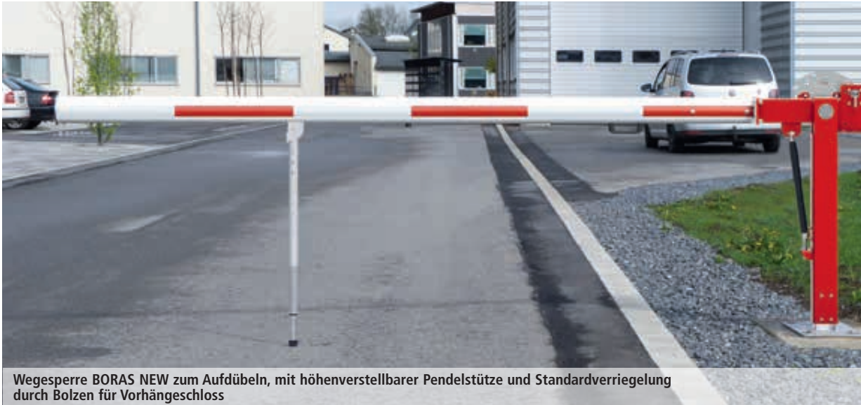
Wegesperre BORAS NEW zum Aufdübeln, mit höhenverstellbarer Pendelstütze und Standardverriegelung durch Bolzen für Vorhängeschloss