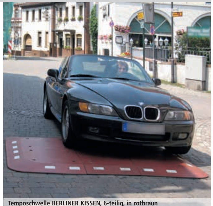
Temposchwelle BERLINER KISSEN, 6-teilig, in rotbraun