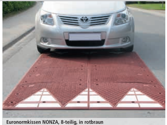
Euronormkissen NONZA, 8-teilig, in rotbraun

Elastikbordsteine, Kreisverkehre und Verkehrsinseln finden Sie online unter: www.ziegler-metall.de