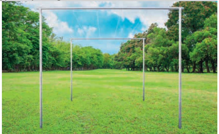
Gerüst mit Wäschestange NAJAK, feuerverzinkt

Standardfarben für Wäschegerüst MAUBEC und Gerüst mit Wäsche- bzw. Teppichklopfstange NAJAK - bitte bei Bestellung Farbe angeben!