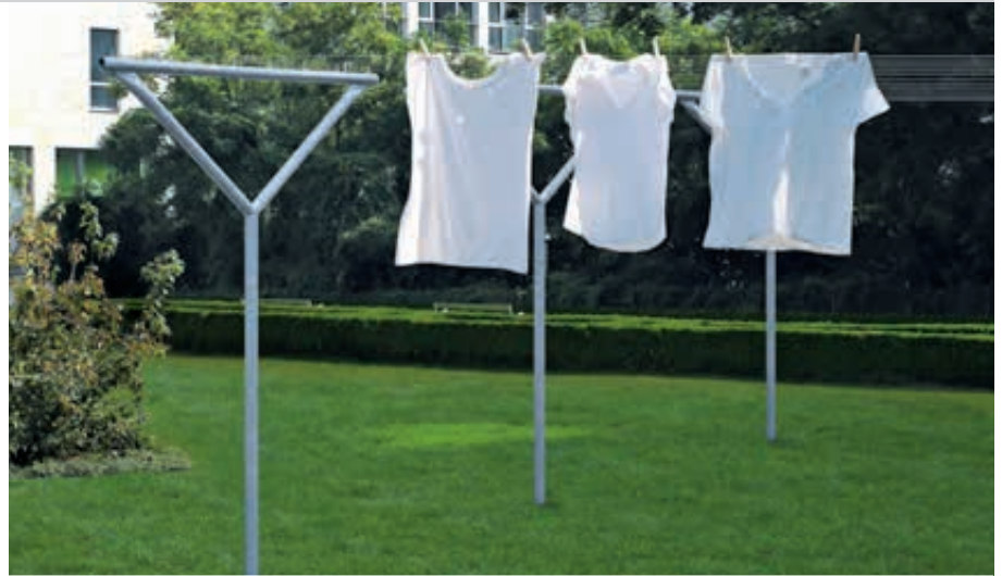
Wäschegerüst MAUBEC, feuerverzinkt