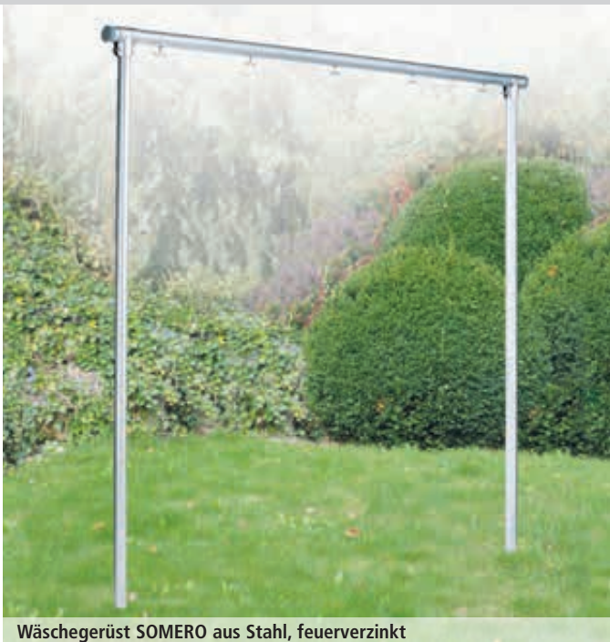
Wäschegerüst SOMERO aus Stahl, feuerverzinkt

Wäschepfähle NIVALA: www.ziegler-metall.de