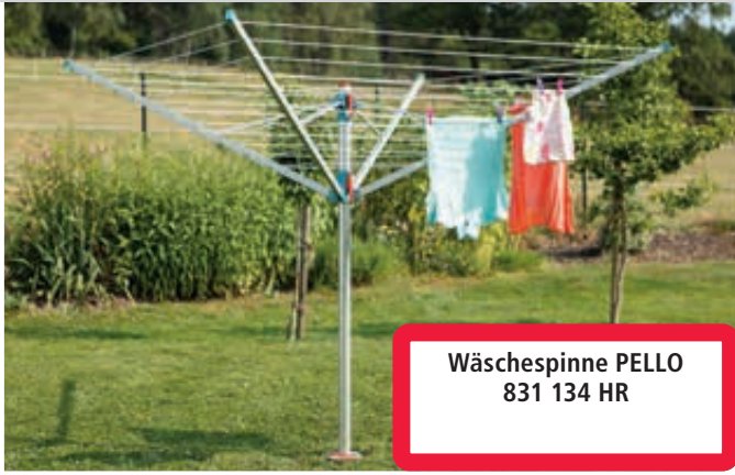
Wäschespinne PELLO 831 134 HR