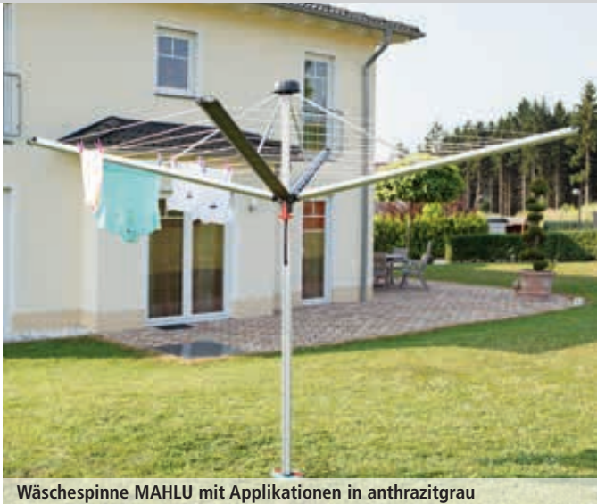
Wäschespinne MAHLU mit Applikationen in anthrazitgrau