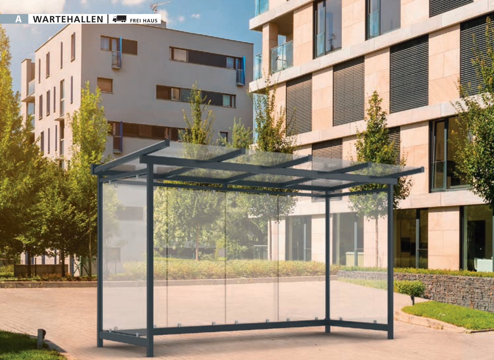
Wartehalle FORNAX, Dachbreite x Dachtiefe 4380 mm x 2065 mm, zum Aufdübeln bei -200 mm, Rück- / Seitenwände ESG, Klarglas, Stahlkonstruktion in RAL 7016 anthrazitgrau