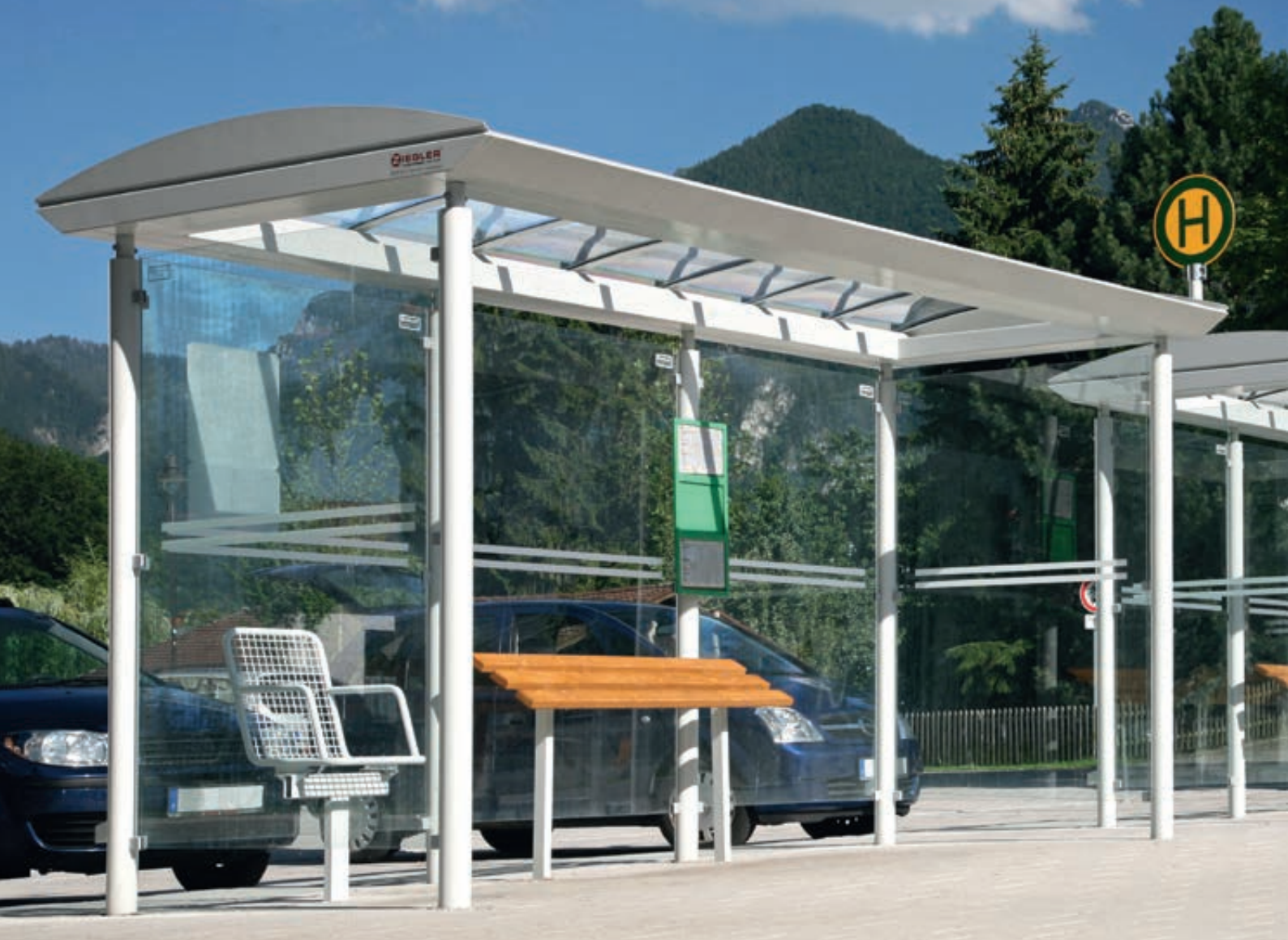
Wartehalle PLUTO, Dachbreite x Dachtiefe 4800 mm x 2030 mm, mit Rück- / Seitenwänden aus ESG, Klarglas mit Siebdruckstreifen, Sitzbank TARVIS, Anlehnbank SMOKY, Stahlkonstruktion in RAL 7035 lichtgrau