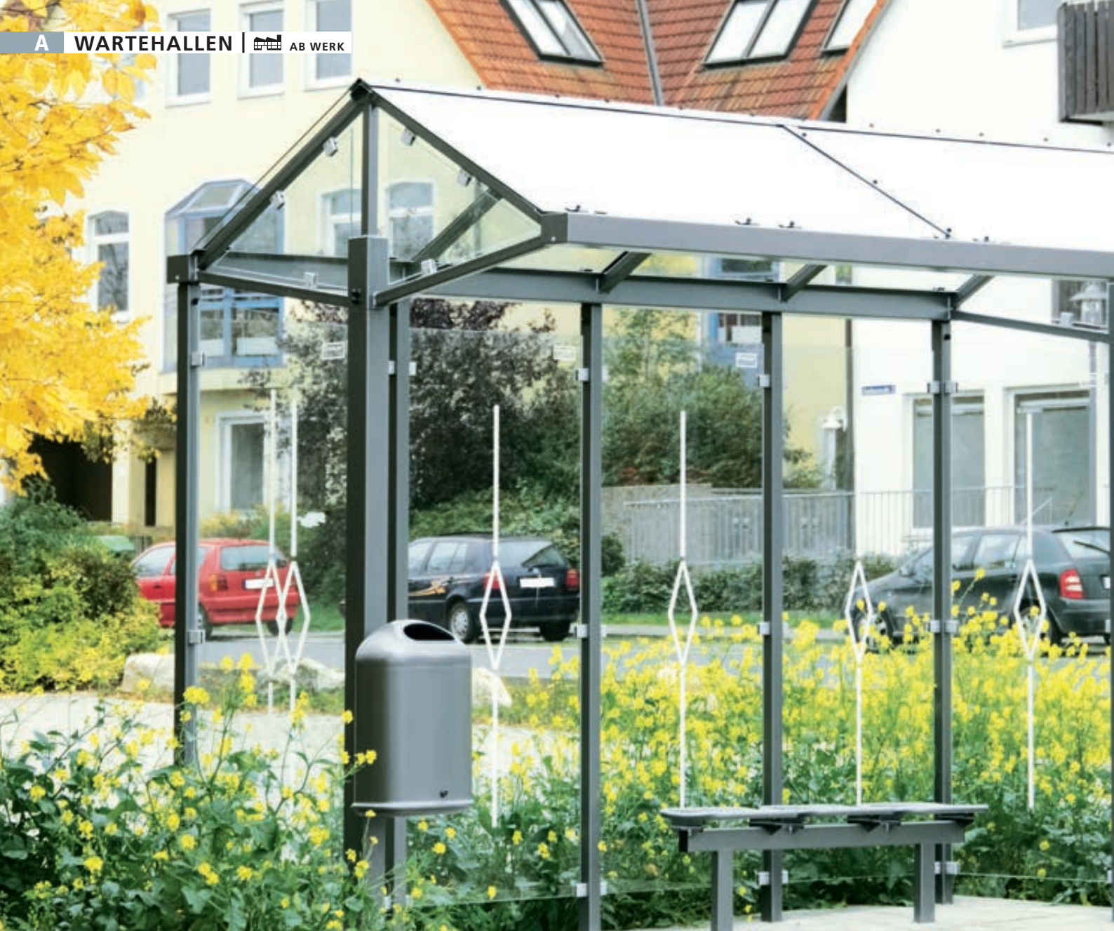
Wartehalle MARS, Dachbreite x Dachtiefe 4000 mm x 1920 mm, Rück- / Seitenwände ESG, Klarglas mit Siebdruck Rautenmotiv, Sitzbank TARVIS sowie Abfallbehälter DERBY, Stahlkonstruktion in DB 703 eisenglimmer