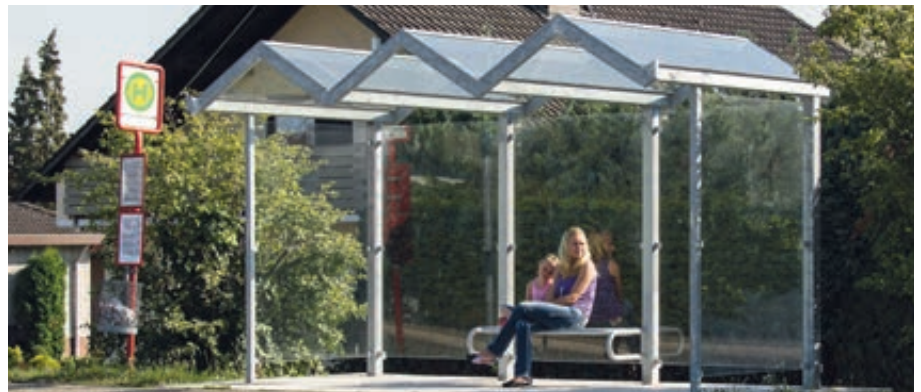
Wartehalle TANGENTA, Dachbreite x Dachtiefe 4700 mm x 2000 mm, Rück- / Seitenwände ESG, Klarglas, mit Sitzbank SESTO, Stahlkonstruktion in RAL 9006 weißaluminium

i Bitte fragen Sie an – gerne erstellen wir Ihnen kostenfrei ein individuelles Angebot für Ihr Bauvorhaben: Tel 07672/958 950