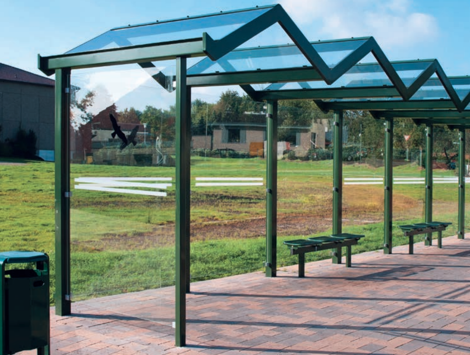
Wartehalle TANGENTA mit auftragsbezogener Anpassung, Dachbreite x Dachtiefe 10700 mm x 2000 mm, Rück- / Seitenwände ESG, Klarglas mit Siebdruckstreifen und Raubvogelaufkleber, mit Sitzbank TARVIS und Abfallbehälter COVENTRY, Stahlkonstruktion in RAL 6020 chromoxidgrün