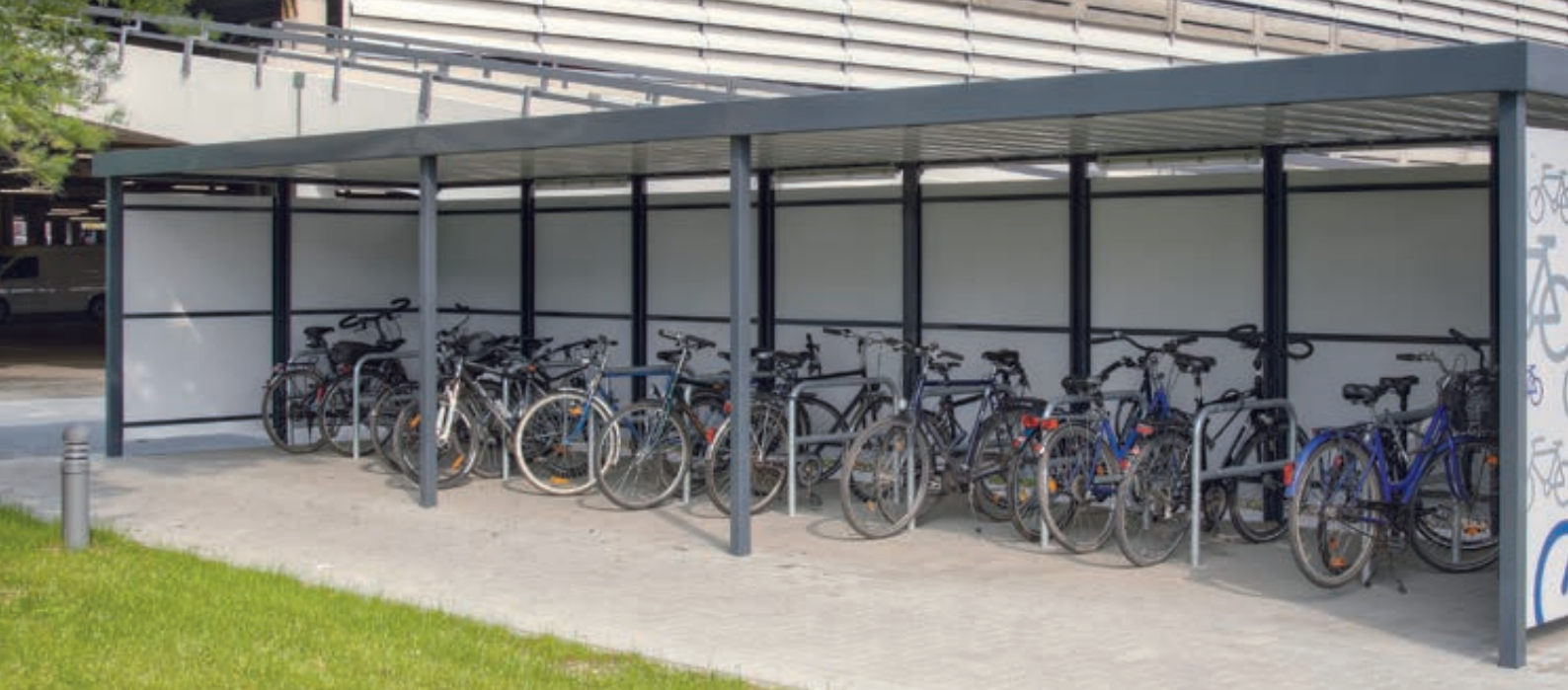
Fahrradüberdachung FLEXI-BOX, auftragsbezogene Anpassung, ca. Dachbreite x Dachtiefe 12300 mm x 3300 mm, Wandelemente Fassadenbautafeln Trespa® in wintergrau, Stahlkonstruktion in RAL 7016 anthrazitgrau