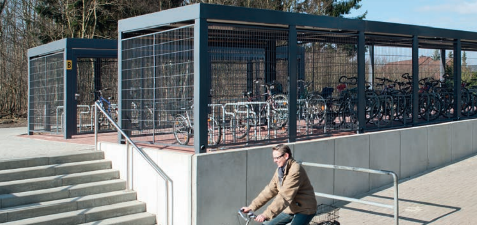
MULTIPOINT® Rad Dachbreite x Dachtiefe je Anlage 16000 mm x 8000 mm, Seiten- und Rückwände mit Doppelstabgittermatten, mit Fahrradparker HEDLAND, Stahlkonstruktion in RAL 7015 schiefergrau