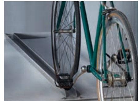
▲ Detail: Führungsschiene, Edelstahl