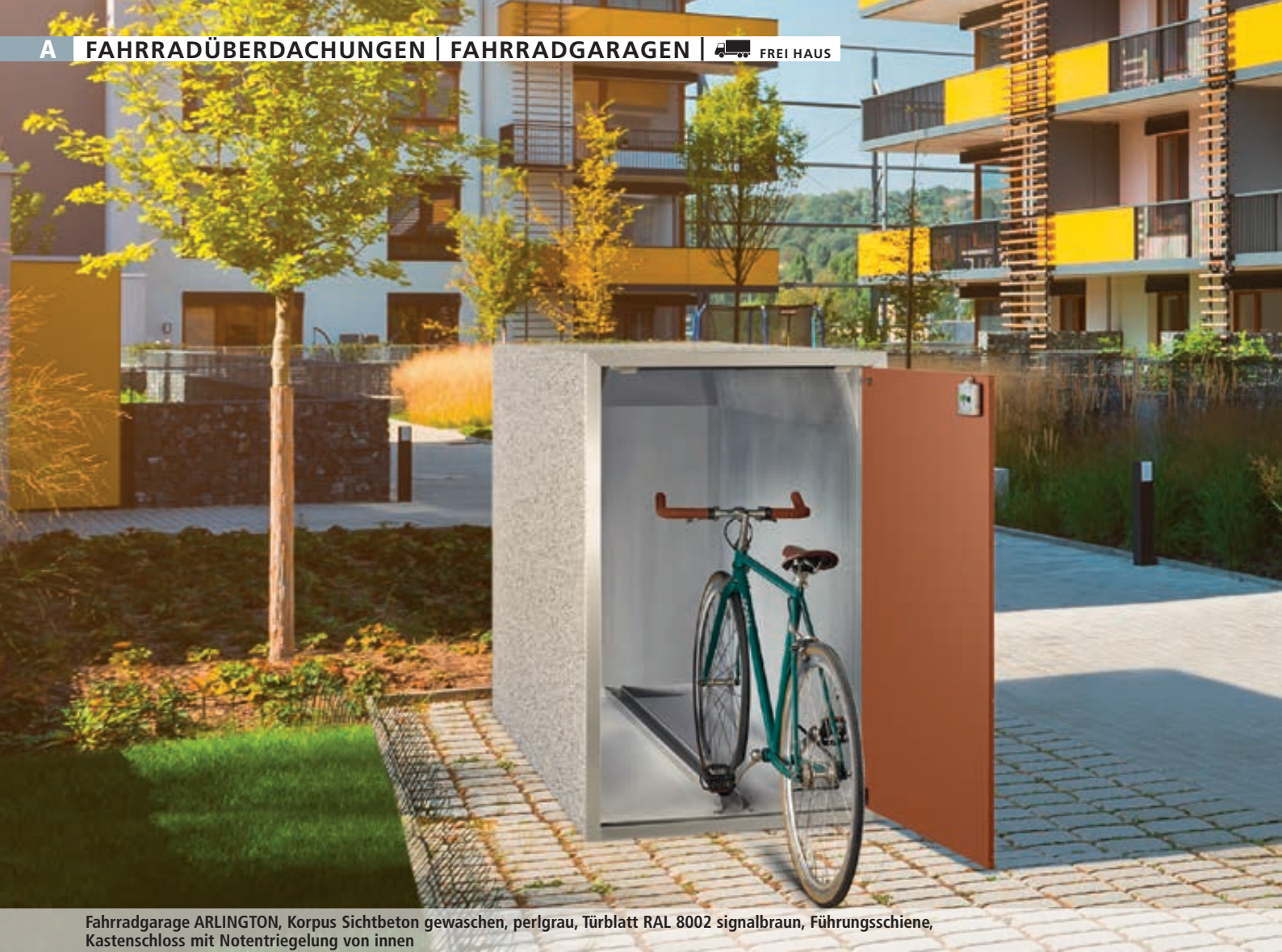
Fahrradgarage ARLINGTON, Korpus Sichtbeton gewaschen, perlgrau, Türblatt RAL 8002 signalbraun, Führungsschiene, Kastenschloss mit Notentriegelung von innen