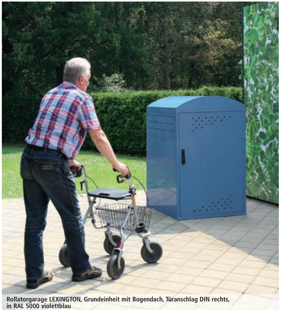
Rollatorgarage LEXINGTON, Grundeinheit mit Bogendach, Türanschlag DIN rechts, in RAL 5000 violettblau

Weitere Bilder, Informationen und Ausschreibungstexte: www.ziegler-metall.at