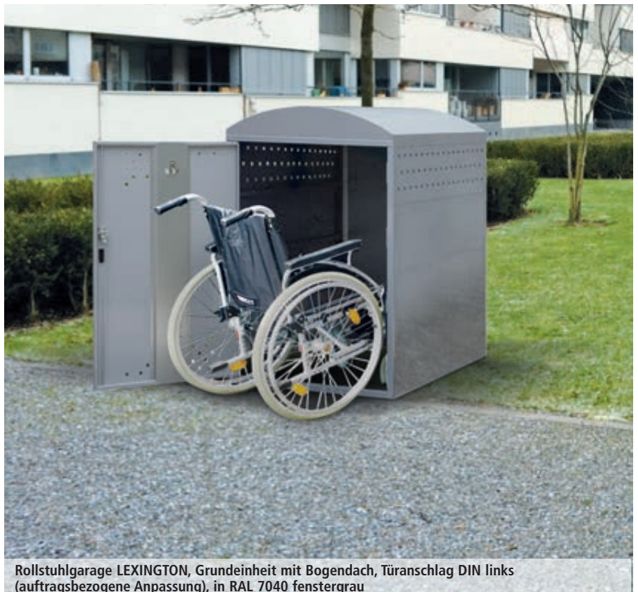
Rollstuhlgarage LEXINGTON, Grundeinheit mit Bogendach, Türanschlag DIN links (auftragsbezogene Anpassung), in RAL 7040 fenstergrau