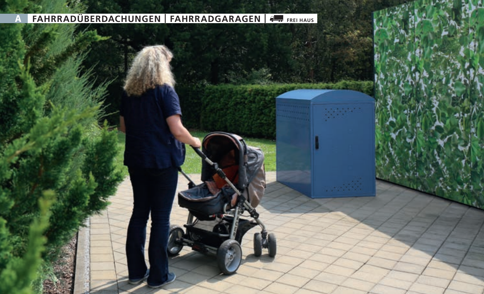
Kindergartenbox LEXINGTON, Grundeinheit mit Bogendach, Türanschlag DIN rechts, in RAL 5000 violettblau