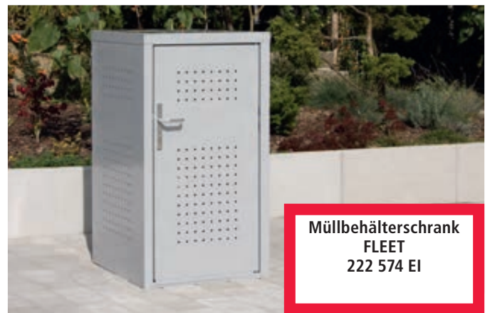
▲ Müllbehälter-Einzelschrank FLEET, in RAL 9006 weißaluminium, Tür mit Türdrücker außen und innen