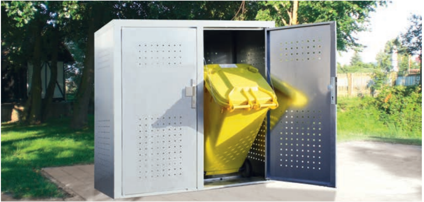
Müllbehälter-Doppelschrank FLEET, in RAL 9006 weißaluminium, Türen mit fester Griffplatte außen und drehbarem Knauf innen