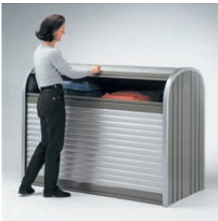
▲ zum Befüllen nur obere Rolllade öffnen