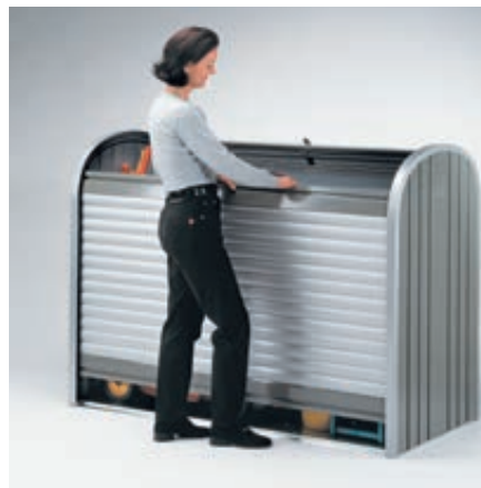
▲ zum kompletten Entleeren untere Rolllade ebenfalls nach hinten schieben