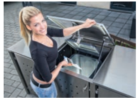
▲ Klappdach mit Gasdruckdämpfer