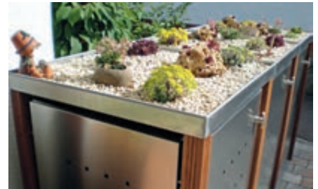
▲ Pflanzdach in Edelstahl mit bauseitiger Dachbegrünung