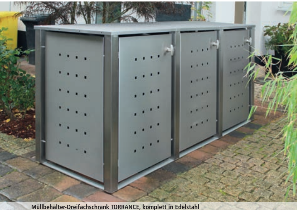
Müllbehälter-Dreifachschrank TORRANCE, komplett in Edelstahl