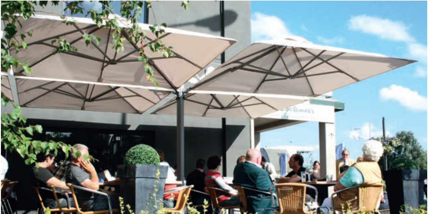
Freiarmschirm MULTI POLE, 4 Schirme, quadratisch, zum freien Aufstellen