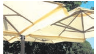
▲ Regenrinne mit Reißverschluss verbindet einfach mehrere Schirme