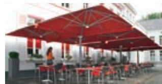
▲ Freiarmschirm MULTI POLE, 2 x 4 Schirme quadratisch