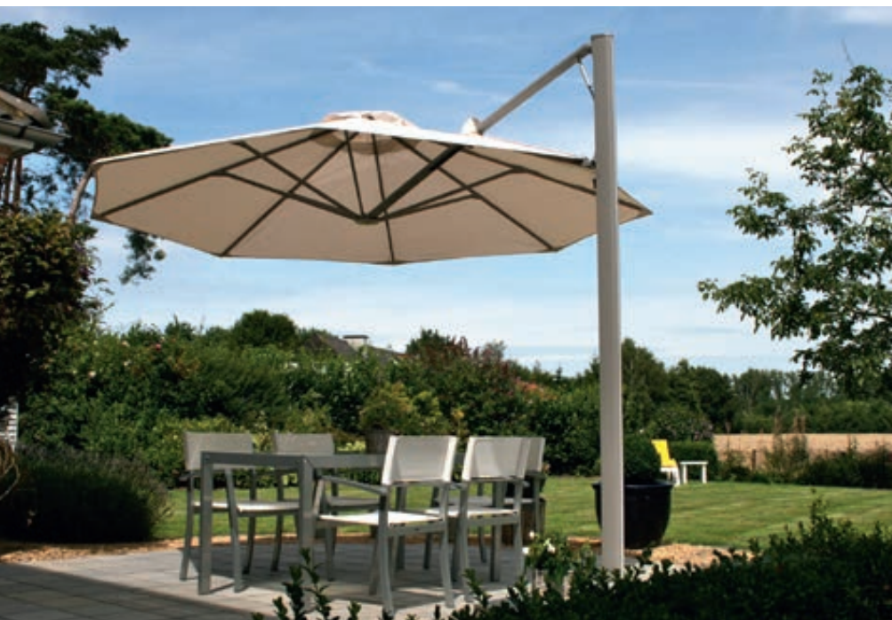
Freiarmschirm SINGLE POLE, achteckig, zum freien Aufstellen, in white sand