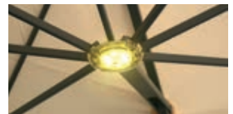
▲ LED Beleuchtung inklusive Fernbedienung