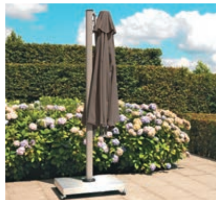
Freiarmschirm SINGLE POLE in lead grey, achteckig (Schirmsockel siehe Zubehör)