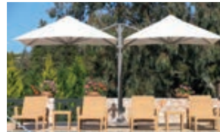
▲ Freiarmschirm MULTI POLE, 2 Schirme, quadratisch, zum freien Aufstellen

Lieferung: Schirmtuch ist nicht vorbespannt.