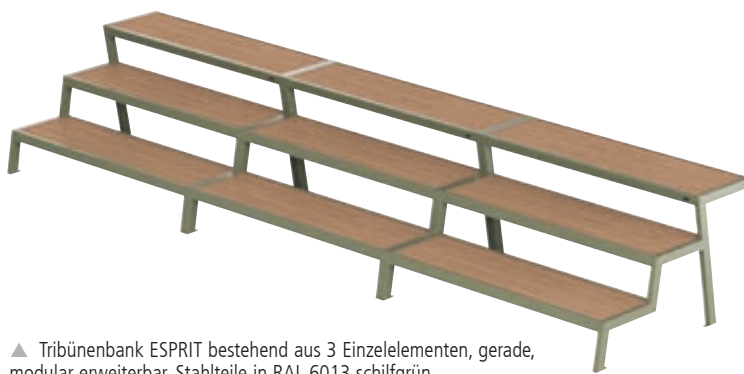
▲ Tribünenbank ESPRIT bestehend aus 3 Einzelementen, gerade, modular erweiterbar, Stahlteile in RAL 6013 schilfgrün