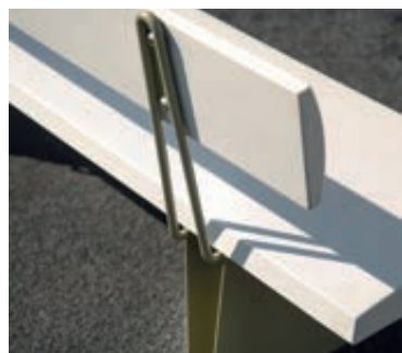
▲ Detail: Rückansicht, Sitzbank MALY mit Rückenlehne, Stahlteile in RAL 6013 schilfgrün