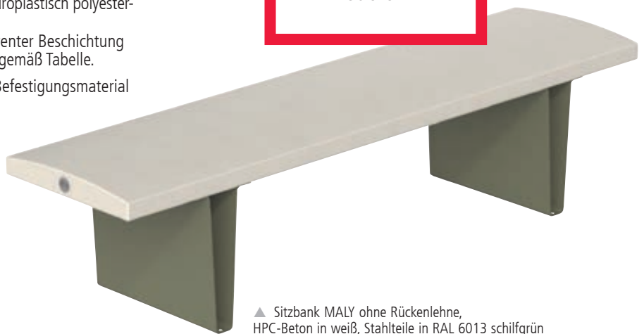
▲ Sitzbank MALY ohne Rückenlehne, HPC-Beton in weiß, Stahlteile in RAL 6013 schilfgrün