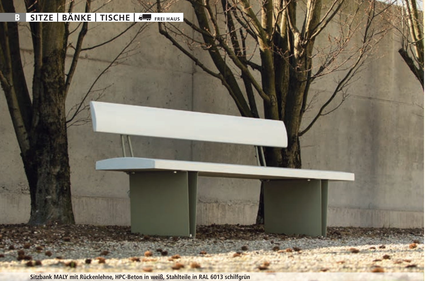
Sitzbank MALY mit Rückenlehne, HPC-Beton in weiß, Stahlteile in RAL 6013 schilfgrün