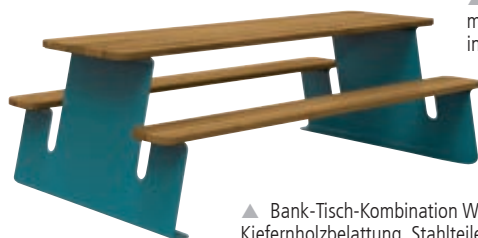
▲ Bank-Tisch-Kombination WAVER mit Hartholzbelattung, Stahlteile in RAL 5010 enzianblau