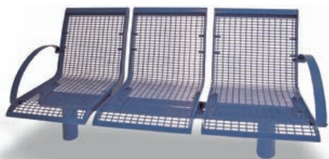
▲ 3-Sitzer LINUS mit Rückenlehne und 2 Armlehnen, in RAL 5002 ultramarinblau