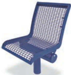
▲ 1-Sitzer LINUS mit Rückenlehne, in RAL 5002 ultramarinblau