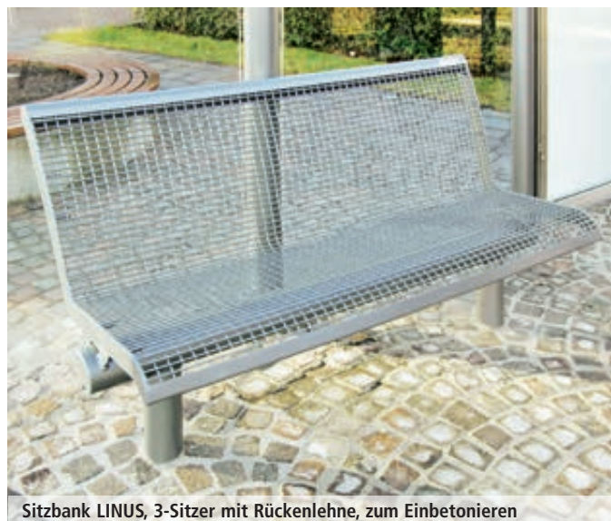
Sitzbank LINUS, 3-Sitzer mit Rückenlehne, zum Einbetonieren