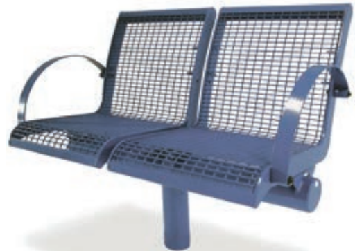
▲ 2-Sitzer LINUS mit Rückenlehne und 2 Armlehnen, in RAL 5002 ultramarinblau