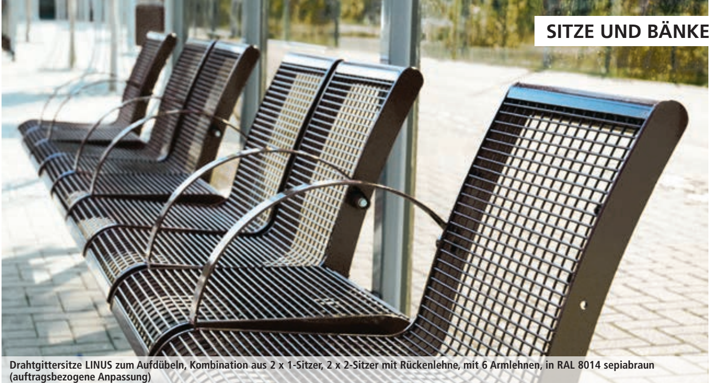
Drahtgittersitze LINUS zum Aufdübeln, Kombination aus 2 x 1-Sitzer, 2 x 2-Sitzer mit Rückenlehne, mit 6 Armlehnen, in RAL 8014 sepiabraun (auftragsbezogene Anpassung)