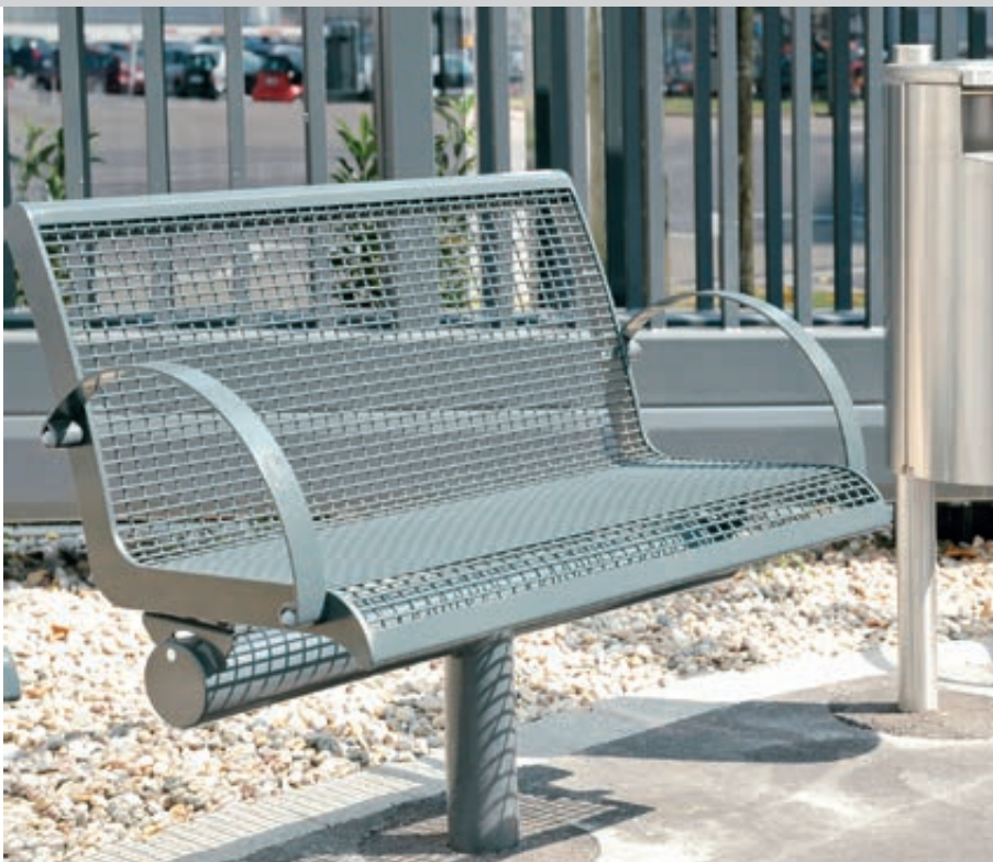
Sitzbank LINUS mit Mittelfuß zum Einbetonieren (auftragsbezogene Anpassung auf Anfrage)

Konstruktion: Sitzbank und Sitz mit Sitzfläche und wahlweise Rückenlehne aus Drahtgitter Raster 25 x 15 mm. Mit Mittelfuß (bei 2-Sitzern) bzw. zwei Füßen (bei 3-Sitzern). Wahlweise mit Armlehnen erhältlich (siehe Zubehör).