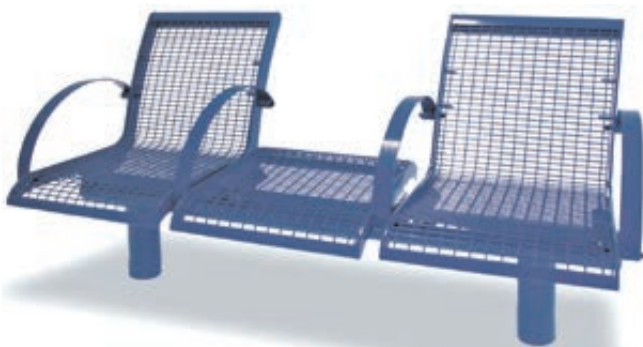
▲ Kombination 2 x 1-Sitzer LINUS mit Rückenlehne und 1 x 1-Sitzer LINUS ohne Rückenlehne zum Aufdübeln, mit 4 Armlehnen in RAL 5002 ultramarinblau (auftragsbezogene Anpassung)