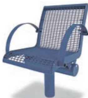
▲ 1-Sitzer LINUS mit Rückenlehne und beidseitig Armlehnen, in RAL 5002 ultramarinblau