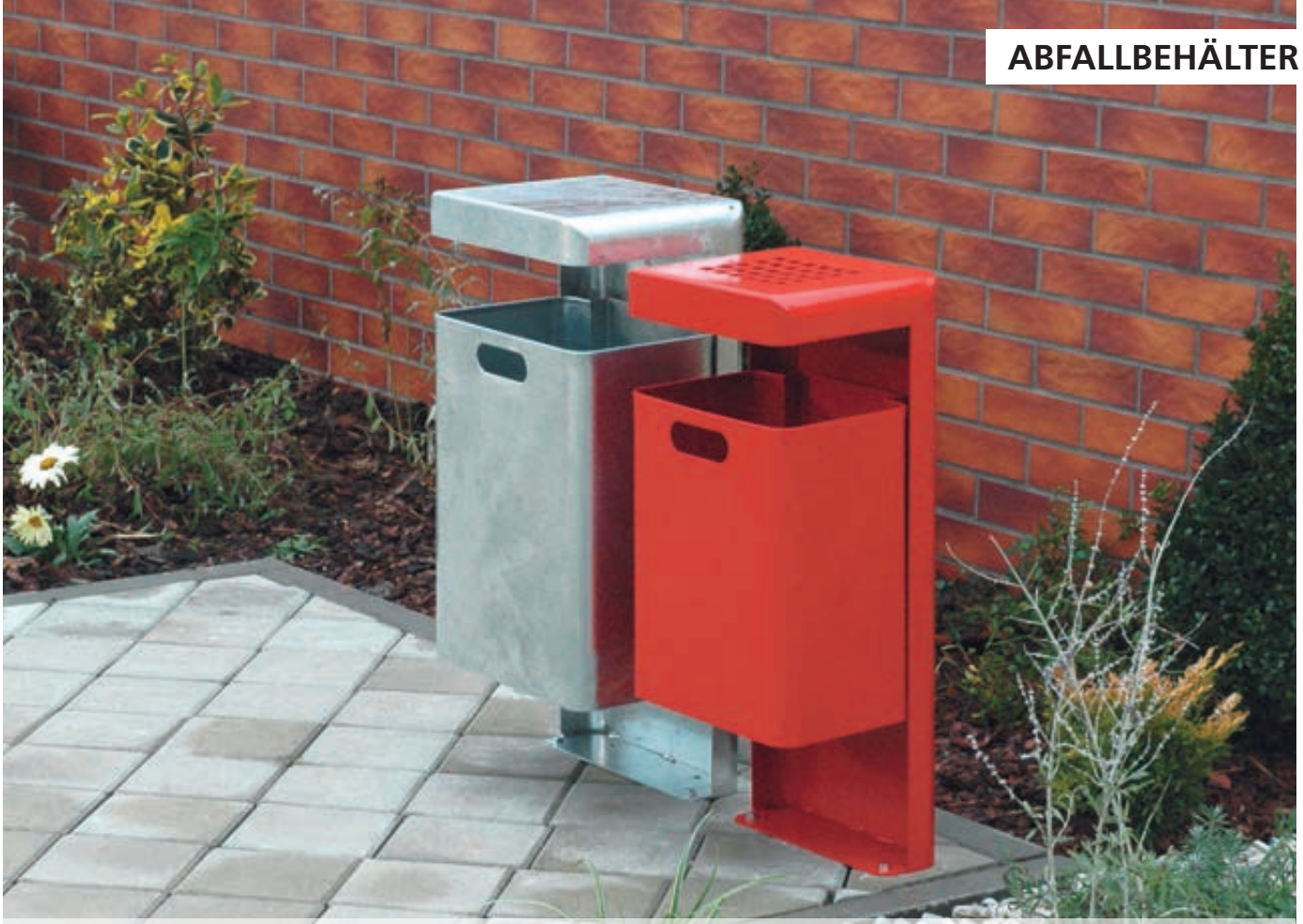
Abfallbehälter HALIFAX, 43 Liter, ohne Ascher, zum Aufdübeln, feuerverzinkt und Abfallbehälter HALIFAX, 29 Liter, mit Ascher, zum Aufdübeln, in RAL 3000 feuerrot