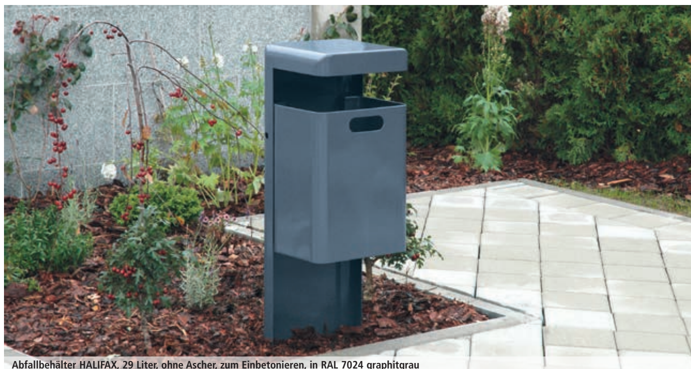
Abfallbehälter HALIFAX, 29 Liter, ohne Ascher, zum Einbetonieren, in RAL 7024 graphitgrau