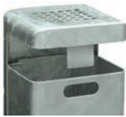
▲ Detail: Hausmüllstop

Konstruktion: Abfallbehälter aus Stahl, Materialstärke 2 mm. Behälterboden mit Flüssigkeitsablauföchern. Abfallbehälter wahlweise mit integriertem Ascher im Schutzdach. Zur Vermeidung von Entsorgung von privatem Hausmüll wahlweise mit integriertem Hausmüllstop (Dachverlängerung).