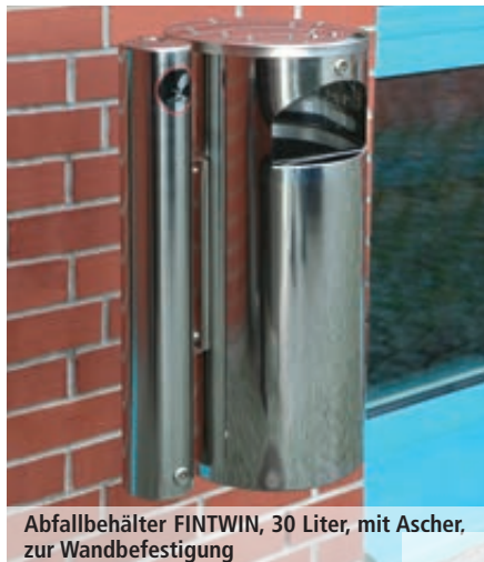
Abfallbehälter FINTWIN, 30 Liter, mit Ascher, zur Wandbefestigung