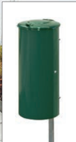
▲ Abfallbehälter NEWPORT, 110 Liter, zum Einbetonieren, in RAL 6005 moosgrün