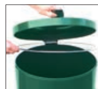
▲ Detail: Deckel geöffnet, Klemmring zur Abfallsackbefestigung