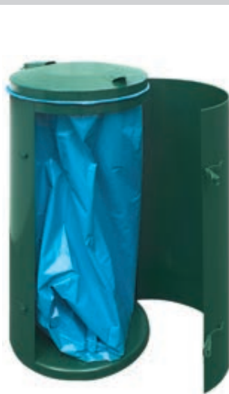
▲ Abfallbehälter SOMERSET, in RAL 6005 moosgrün, zum freien Aufstellen, Tür geöffnet

Weitere Abfallbehälter finden Sie online unter: www.ziegler-metall.at