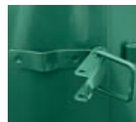
▲ Detail: Bügelverschluss