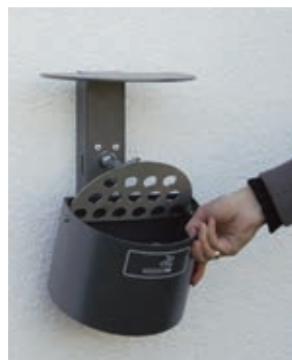
▲ Entleerung von Halbrundascher KERRY mit Schutzdach, Wandbefestigung, in DB 703 eisenglimmer