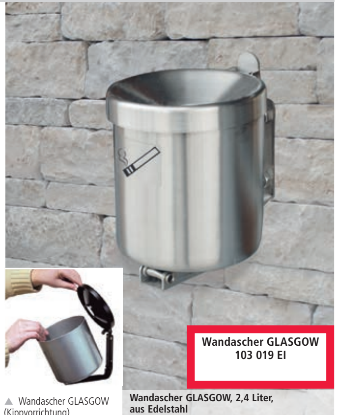
Wandascher GLASGOW 103 019 EI