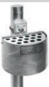
▲ Halbrundascher KERRY, befestigt an Pfosten (Zubehör), feuerverzinkt

Konstruktion: Rund- bzw. Halbrundascher aus Stahlblech mit Edelstahl-Sieb bzw. komplett aus Edelstahl, wahlweise mit Schutzdach. Mit Wasserablauf. Lieferung inkl. Piktogramm-Aufkleber „Zigarette“.