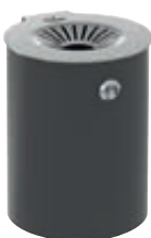
Wandascher M2 in RAL 7016 anthrazit