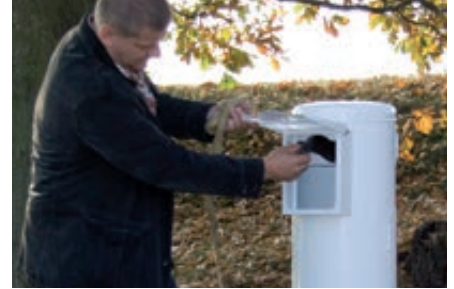
▲ Beutel entnehmen, Hundekot mit umgestülptem Beutel aufnehmen und zuknoten