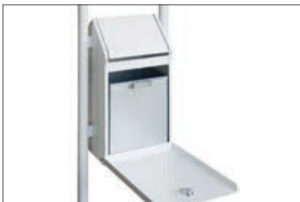
▲ Detail: Entleerung