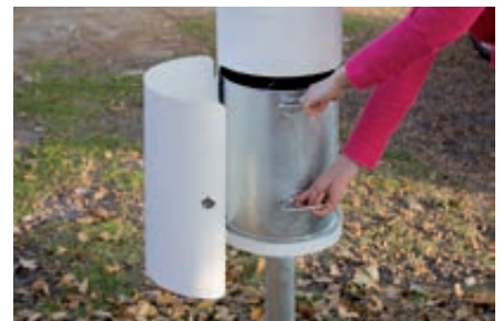
▲ Innenbehälter zum Entleeren entnehmen