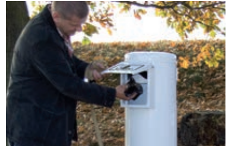
▲ Beutel einwerfen