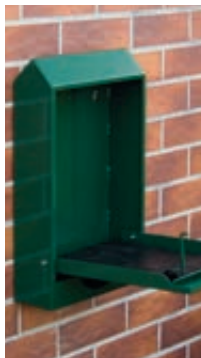
▲ Hundekotbeutel-spender COLLIE, zur Wandbefestigung, in RAL 6005 moosgrün, geöffnet zum Befüllen