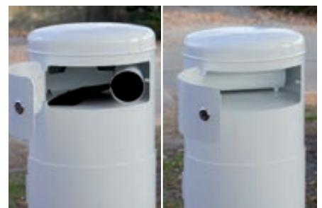
▲ Beutelspender befüllen

Weitere Hundetoiletten finden Sie online unter: www.ziegler-metall.at