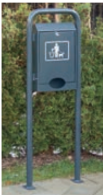
▲ Hundekotbeutel-spender COLLIE, zum Aufdübeln, in RAL 7016 anthrazitgrau