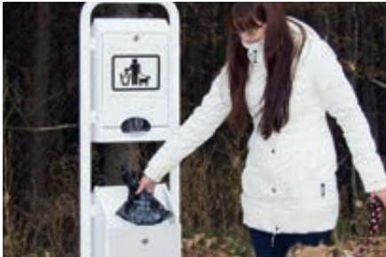
▲ Beutel einwerfen