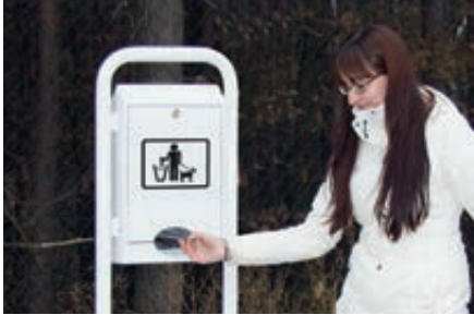
▲ Beutel entnehmen, Hundekot mit umgestülptem Beutel aufnehmen und zuknoten