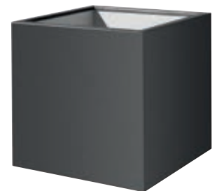
▶ Pflanzbehälter MALOUT, 34 Liter, Höhe 400 mm, in RAL 7016 anthrazitgrau