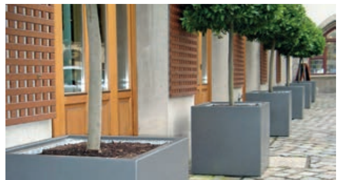
▲ Pflanzbehälter MALOUT, 191 Liter, Höhe 650 mm, in RAL 7046 telegrau 2