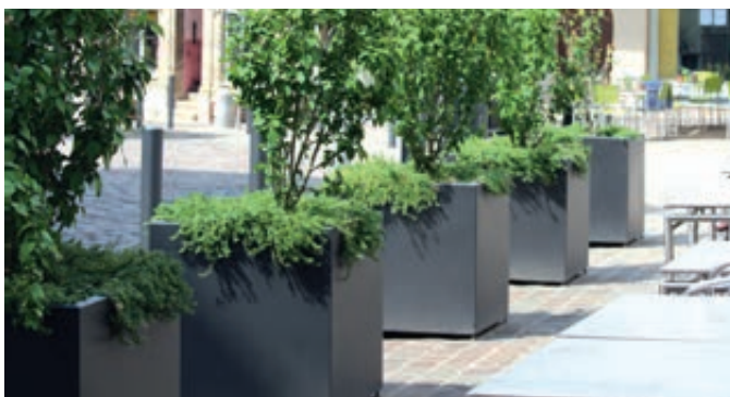
▲ Pflanzbehälter MALOUT, 246 Liter, Höhe 700 mm, in DB 703 eisenglimmer