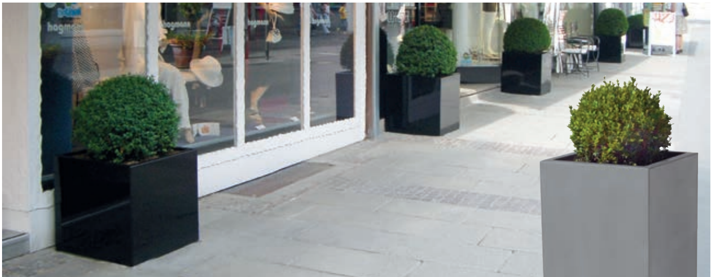
Pflanzbehälter MALOUT, 191 Liter, Höhe 650 mm, in RAL 9005 tiefschwarz