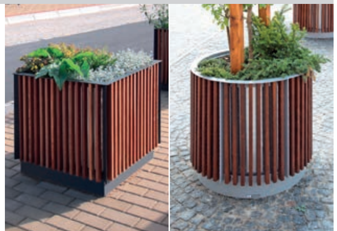
▲ Pflanzbehälter FLORIUM, quadratisch, mit Jatobaholzbelattung, Stahlteile in RAL 7016 anthrazitgrau