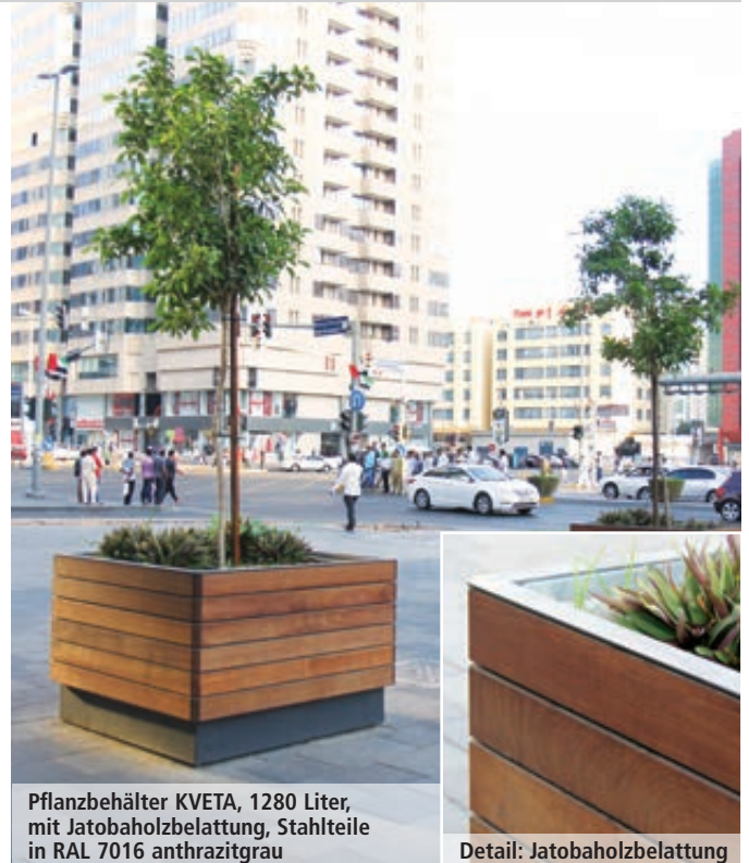
Pflanzbehälter KVETA, 1280 Liter, mit Jatobaholzbelattung, Stahlteile in RAL 7016 anthrazitgrau