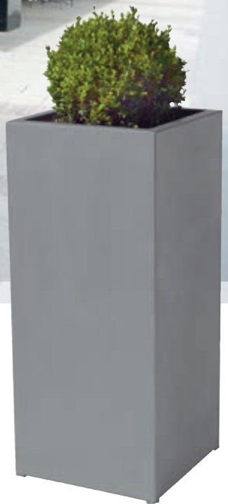
▲ Pflanzbehälter MALOUT, 53 Liter, Höhe 1000 mm, in RAL 9007 grau-aluminium