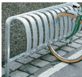
▲ Fahrradständer TOUR einseitig, zum Einbetonieren, 3 Stellplätze, feuerverzinkt