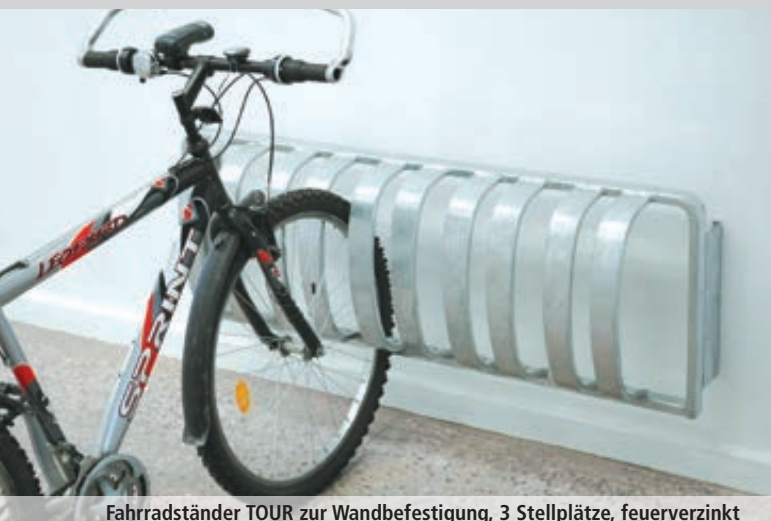
Fahrradständer TOUR zur Wandbefestigung, 3 Stellplätze, feuerverzinkt