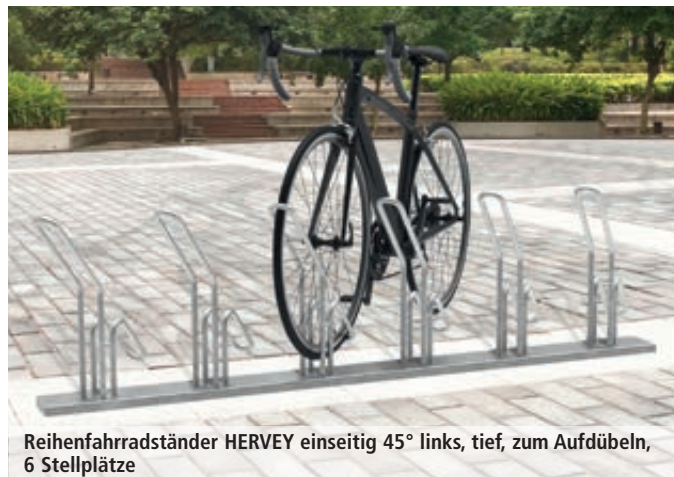
Reihenfahrradständer HERVEY einseitig 45° links, tief, zum Aufdübeln, 6 Stellplätze