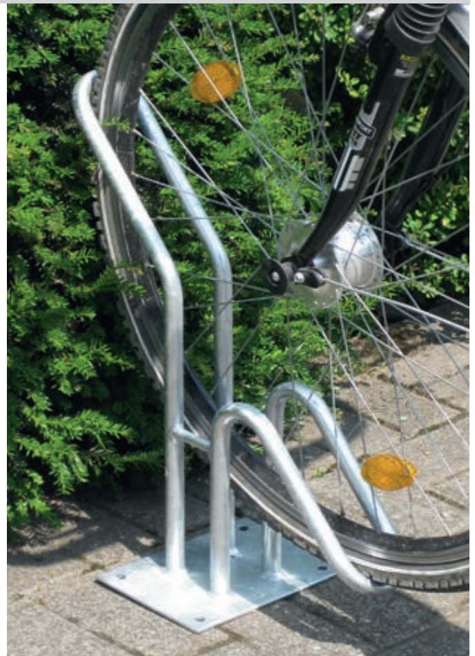
Einzelfahrradständer HERVEY einseitig, tief, zum Aufdübeln, 1 Stellplatz