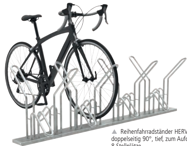
▲ Reihenfahrradständer HERVEY doppelseitig 90°, tief, zum Aufdübeln, 8 Stellplätze