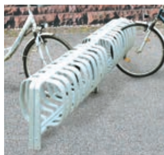
▲ Fahrradständer TOUR doppelseitig, zum Einbetonieren, 6 Stellplätze, feuerverzinkt