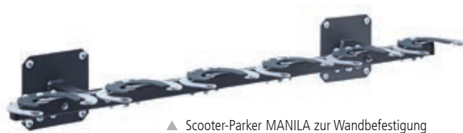
▲ Scooter-Parker MANILA zur Wandbefestigung