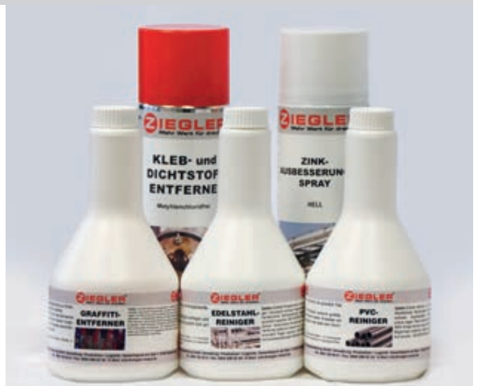
Graffiti-entferner, Edelstahlreiniger, PVC-Reiniger, Dicht- und Klebstoffentferner sowie Zinkausbesserungsspray hell

Graffiti-entferner: Zur Entfernung von Spraylacken auf Metallen, Glas, Keramik sowie harten Kunststoffen (flüssig und CKW-frei).