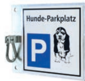
▲ Hunde-Parkplatz BEAGLE zur Wandbefestigung, feuerverzinkt

Konstruktion: Grundplatte aus Stahlblech mit PVC-Standardaufdruck (200 x 200 mm), wie Abbildung. Ausführungen zur Bodenbefestigung mit zusätzlichem Standpfosten. Serienmäßig mit Karabiner.