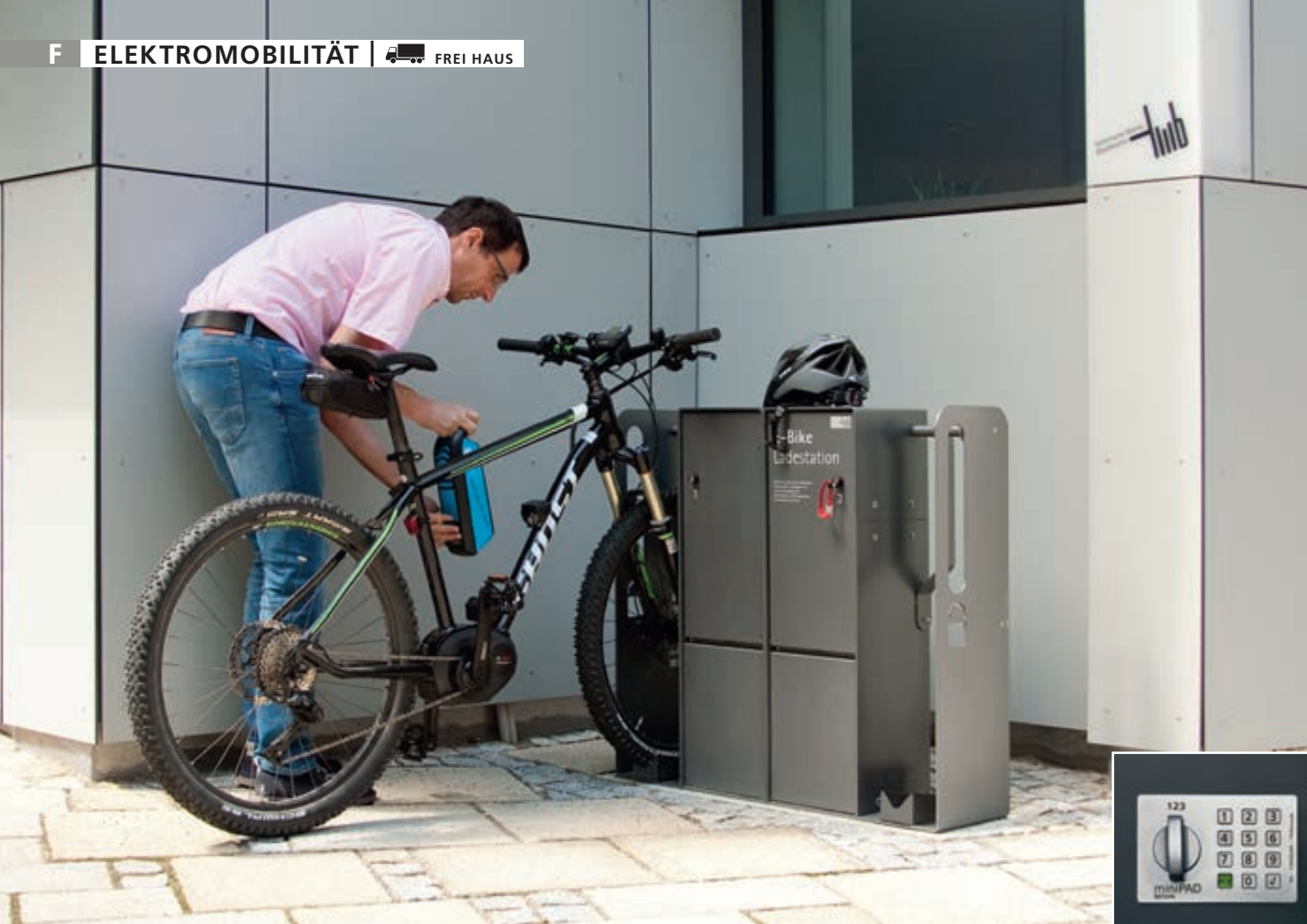
Fahrrad-Abstellanlage VELO-CONNECTOR mit Ladeschließfach, für Radeinstellung links bzw. rechts, Stahlteile in DB 703 eisenglimmer