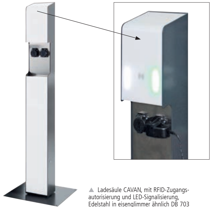
▲ Ladesäule CAVAN, mit RFID-Zugangsautorisierung und LED-Signalisierung, Edelstahl in eisenglimmer ähnlich DB 703