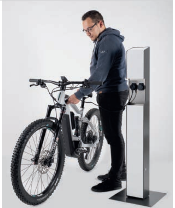
Ladesäule CAVAN, ohne Zugangsautorisierung, Edelstahl in eisenglimmer ähnlich DB 703