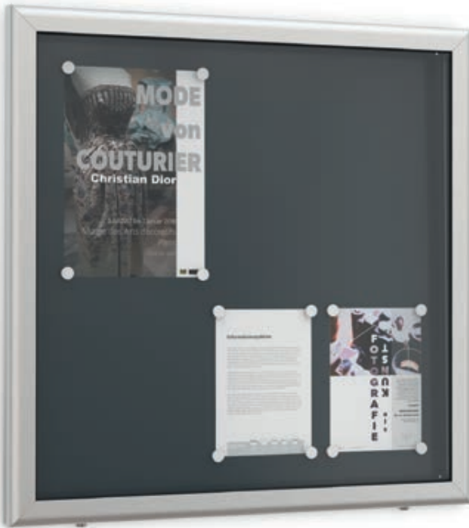
▲ Schaukasten LUINO für 6 x DIN A4, Rückwand anthrazit