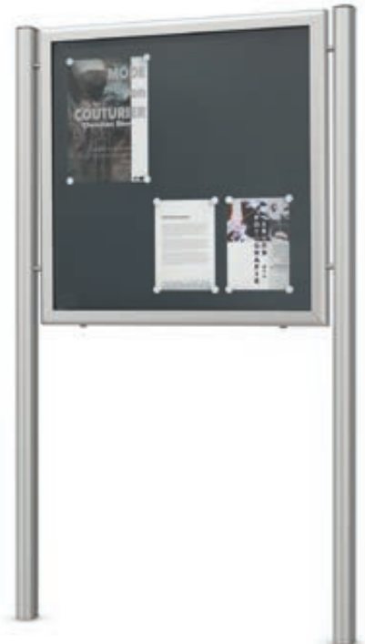
► Schaukasten LUINO für 6 x DIN A4, mit Softline-Rohrständer (Zubehör), Rückwand anthrazit