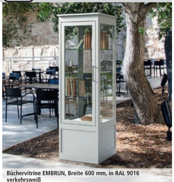
Büchervitrine EMBRUN, Breite 600 mm, in RAL 9016 verkehrsweiß