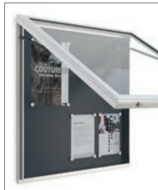
▲ Gasdruckfedern für Klappflügelöffnung nach oben