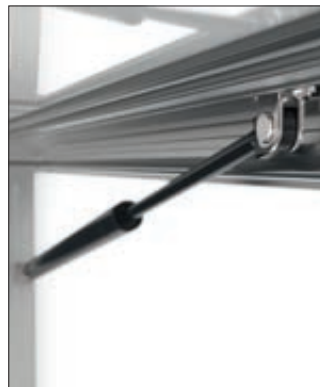
▲ automatische Arretierung des Flügels

Konstruktion: Einseitig nutzbarer Schaukasten mit abgerundetem Softline-Profil aus Aluminium. Verwindungsfreie Konstruktion mit innenliegenden Eckverbindern. Komfortable Klappflügel-Öffnung nach oben, unterstützt durch Gasdruckfedern, mit automatischer Arretierung des Flügels. Rückwand aus Stahlblech, magnethaftend inkl. 10 Haftmagneten. Frontscheibe aus ESG-Sicherheitsglas mit wetterfester Gummidichtung. Inkl. Textblende aus weißem, lichtdurchlässigem Acryl (ohne Text - leicht zu entnehmen für eine spätere Beschriftung). Von unten abschließbar mittels Sicherheitsschlössern (je Schloss 2 Schlüssel).