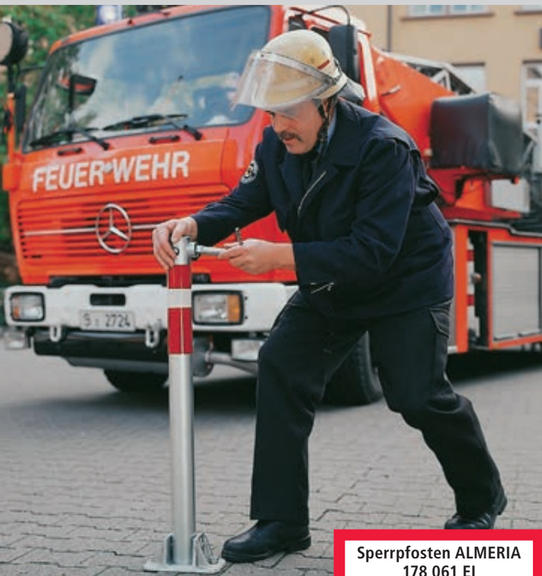
Sperrpfosten ALMERIA zum Aufdübeln, beidseitig kippbar