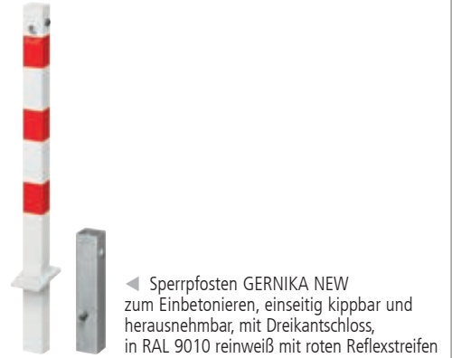
◀ Sperrpfosten GERNIKA NEW zum Einbetonieren, einseitig kippbar und herausnehmbar, mit Dreikantschloss, in RAL 9010 reinweiß mit roten Reflexstreifen

▲ Wenn es die Situation erfordert, können kippbare Sperrpfosten auch zusätzlich herausnehmbar zum Einsatz kommen