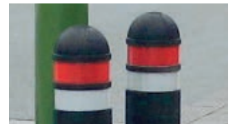
▲ Retroreflexstreifen in weiß und rot (siehe Mehrpreis)