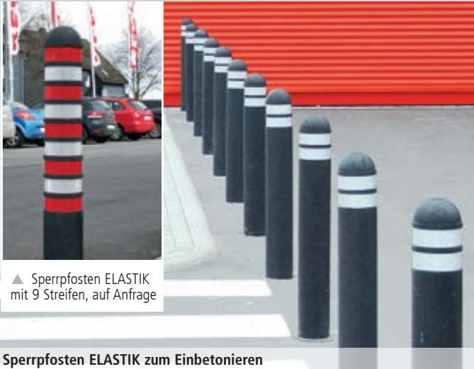
▲ Sperrpfosten ELASTIK mit 9 Streifen, auf Anfrage