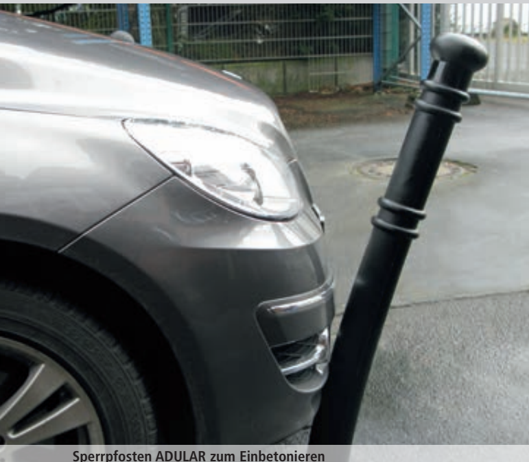
Sperrpfosten ADULAR zum Einbetonieren