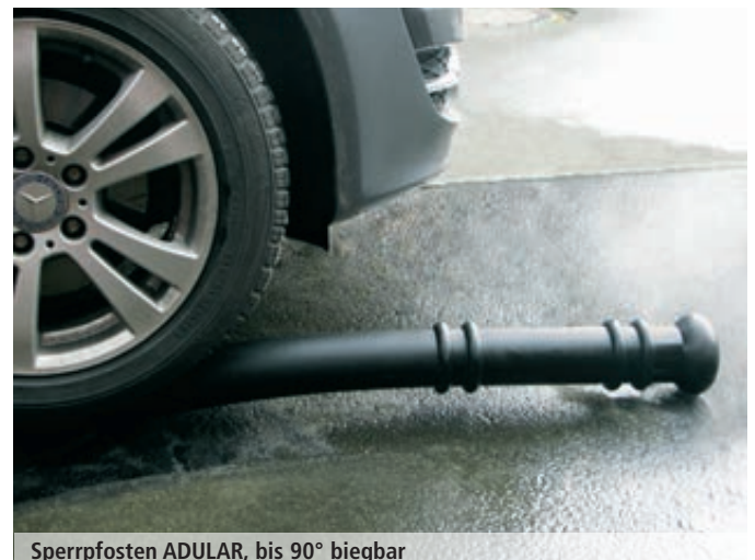
Sperrpfosten ADULAR, bis 90° biegsam