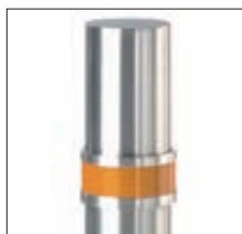
▲ Reflektor-Mittelring gelb (siehe Zubehör)