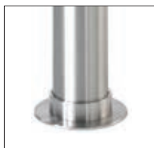
▲ Sockelring aus Edelstahl (siehe Zubehör)