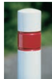
◀ gegen Mehrpreis rot-weiß pulverbeschichtet

Poller AMORA finden Sie online unter: www.ziegler-metall.at