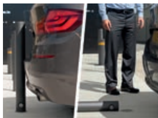
Das austauschbare Verbindungsstück bricht an der Sollbruchstelle (hier: Standardausführung ohne Wegrollsicherung).