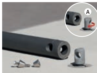
A - Neues Verbindungsstück in Bodenhülse einsetzen und um 90° drehen

ausgezeichnet durch das Design Zentrum NRW mit dem „reddot“ für hohe Designqualität