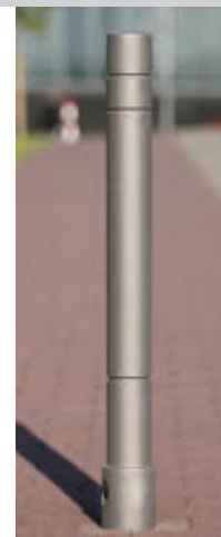
▲ Poller TARANIS mit drei Rillen in DB 703 eisenglimmer