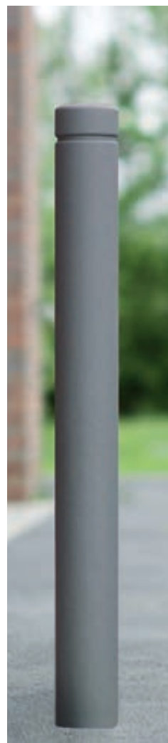
▲ Poller VARIO in DB 703 eisenglimmer

Konstruktion: Poller aus Aluminiumguss mit witterungsbeständiger Aluminiumlegierung und durchgehendem eingegossenem Stahlrohrkern.