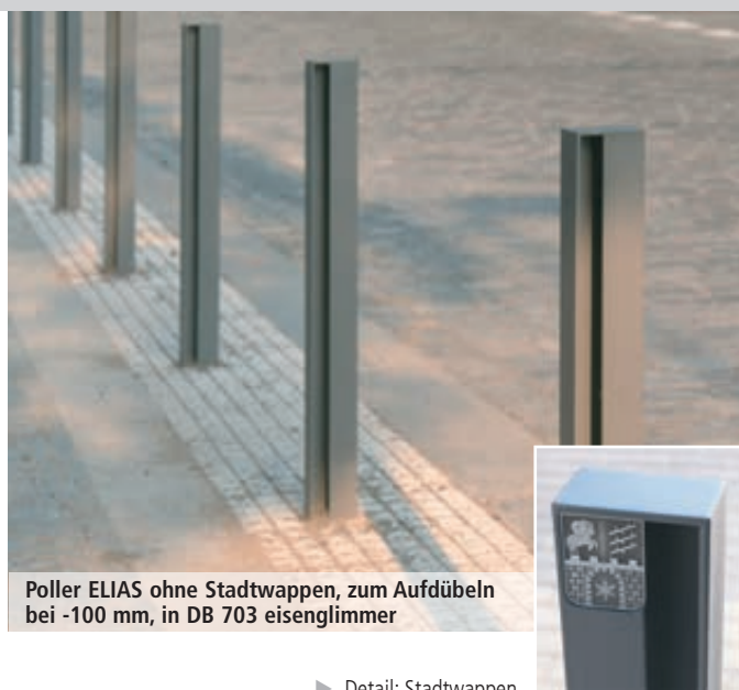
Poller ELIAS ohne Stadtwappen, zum Aufdübeln bei -100 mm, in DB 703 eisenglimmer