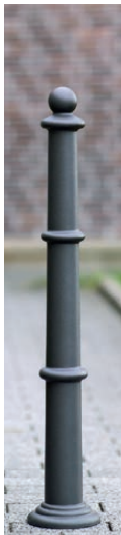
▲ Poller PRIMUS in RAL 7016 anthrazitgrau