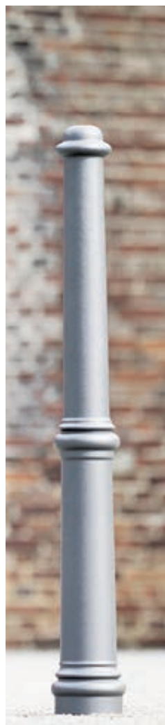
▲ Poller ANTIKE I, ohne Reliefstruktur, in DB 703 eisenglimmer