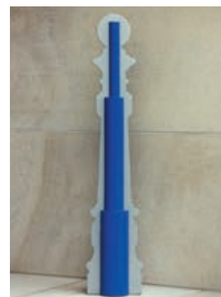
▲ serienmäßig mit verstärktem Innenleben

Befestigungsart: Zum Einbetonieren (empfohlene Einbautiefe 300 mm) bzw. zum Einbetonieren mit Bodenhülse (empfohlene Einbautiefe 500 mm).