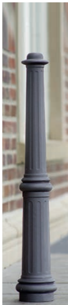
▲ Poller ANTIKE I, mit Reliefstruktur, in RAL 7016 anthrazitgrau