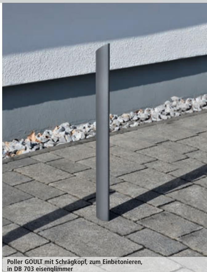
Poller GOULT mit Schräggkopf, zum Einbetonieren, in DB 703 eisenglimmer