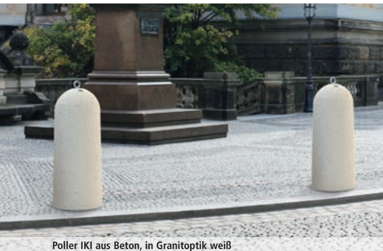
Poller IKI aus Beton, in Granitoptik weiß