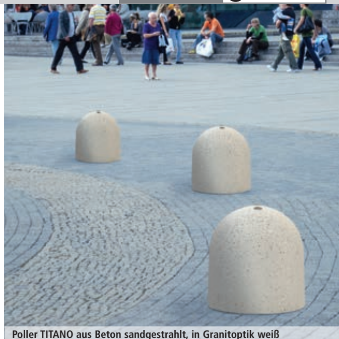
Poller TITANO aus Beton sandgestrahlt, in Granitoptik weiß