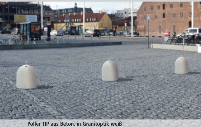
Poller TIP aus Beton, in Granitoptik weiß