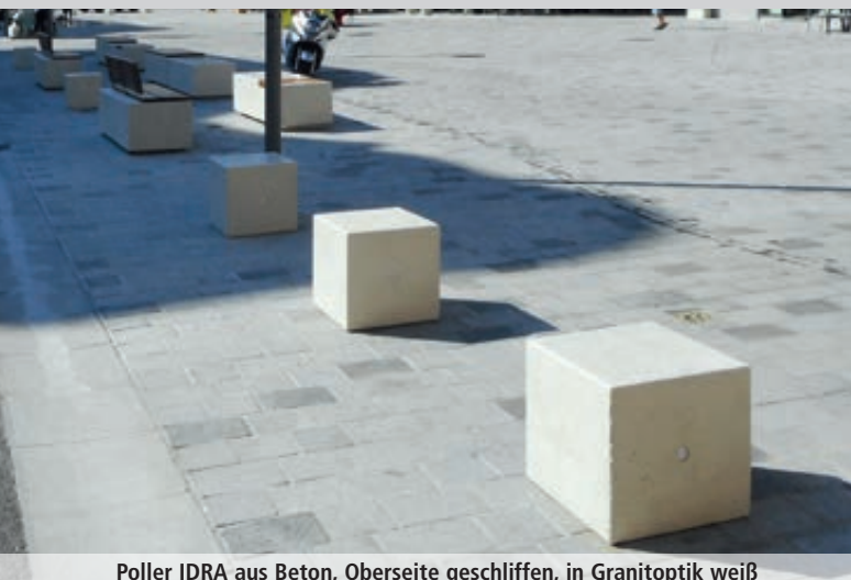
Poller IDRA aus Beton, Oberseite geschliffen, in Granitoptik weiß