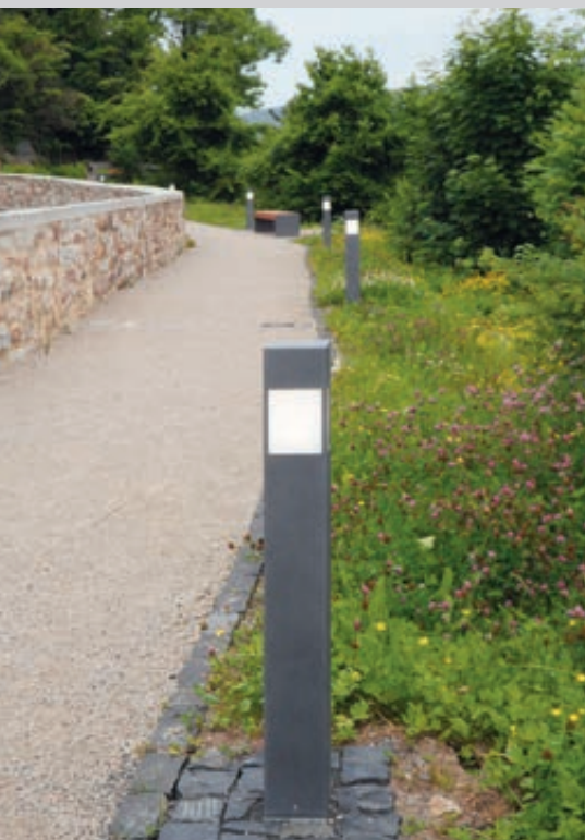
Pollerleuchte PORNIC, Leuchtenabdeckung aus opalem und schlagzähem PMMA RESIST, Farbtemperatur 4000K neutralweiß

Konstruktion: Pollerleuchte aus quadratischem Edelstahlprofil mit abnehmbarem Leuchtkörper. Leuchtenabdeckung aus opalem und schlagzähem PMMA RESIST.