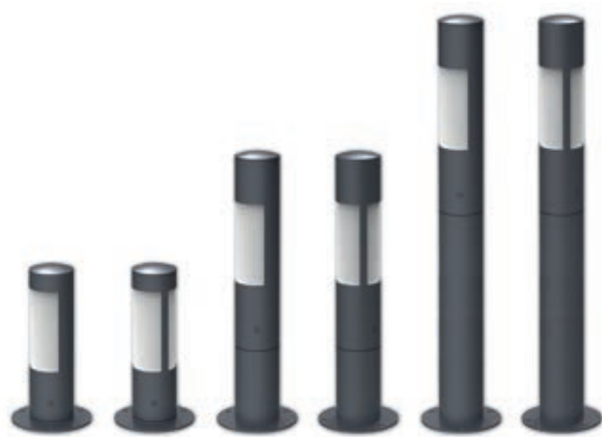
▲ Pollerleuchten SAGUNT mit ein oder zweiseitigem Lichtaustritt, Höhen 350 mm, 600 mm, 900 mm