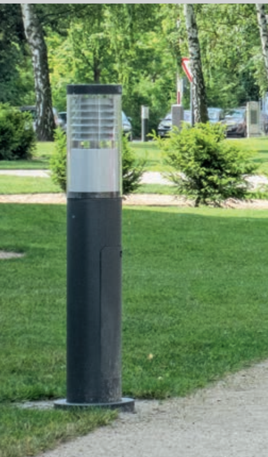
Pollerleuchte KLARA, Lichtaustritt umlaufend, mit Spiegellamellen, mit Tür und Kabelübergangskasten

Konstruktion: Gehäuse und Standrohr aus Stahl (Ø 170 mm). Kappe aus pulverbeschichtetem Edelstahl. Abdeckung aus opalem oder klarem schlagzähem PMMA RESIST. Bei klarer Abdeckung mit Spiegellamellen aus hochwertigem eloxierten Reinstaluminium zur Lichtlenkung und Blendungsbegrenzung. Alle elektrischen Bauteile sind auf einem Elektroblock zusammengefasst und bei der Ausführung 1000 mm Höhe mit Masttür inkl. Kabelübergangskasten (Sicherungssystem 2x D01 (E14), 16A/400V, Zugang 2 Kabel bis 5x16mm 2 , 3 Kabel bis 5x10mm 2 ) ausgestattet.