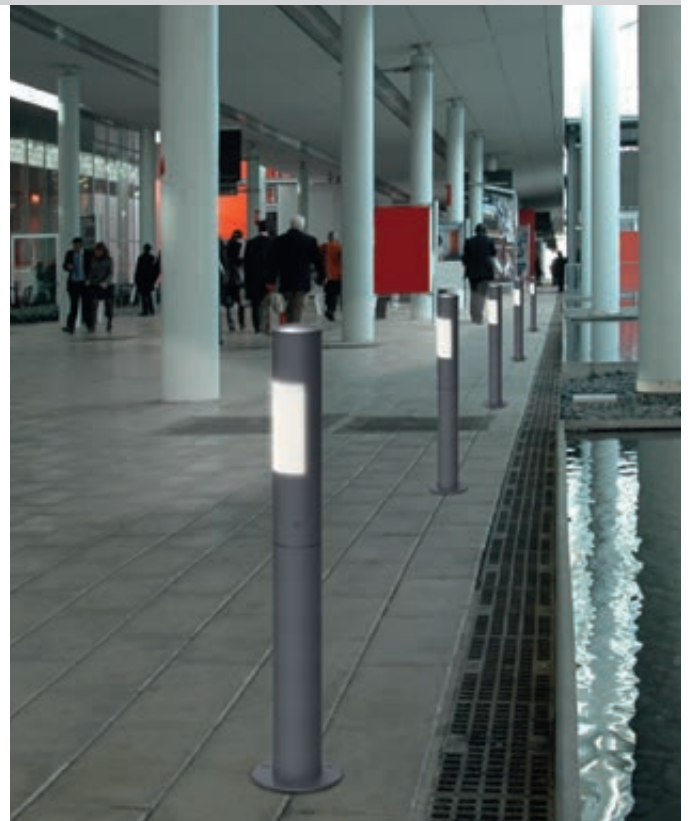
Pollerleuchte SAGUNT mit einseitigem Lichtaustritt, Höhe 900 mm