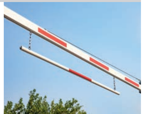
bewegliche Barriere (Zubehör)