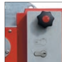
▲ Schlosskasten mit Profilhalbzylinderschloss und Blind-PZ-Einsatz (siehe Zubehör)