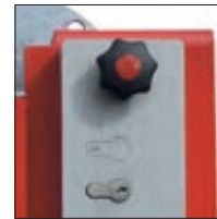
▲ Schlosskasten mit Profilhalbzylinderschloss und Blind-PZ-Einsatz (siehe Zubehör)