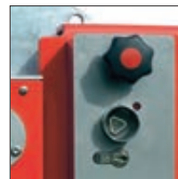
▲ Schlosskasten mit Feuerwehdreikant und Profilhalbzylinder für Hauptstütze

Befestigungsart: Zum Einbetonieren, empfohlenes Fundament der Hauptstütze (L x B x T) 600 x 600 x 800 mm, empfohlenes Fundament der Auflagestütze (L x B x T) 400 x 400 x 600 mm bzw. zum Aufdübeln bei +/- 0 mm mit Fußplatte Hauptstütze (L x B) 400 x 270 mm, Auflagestütze (L x B) 200 x 200 mm). Befestigungsmaterial siehe Zubehör.