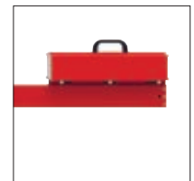
▲ Detail: Gegengewicht