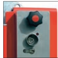
▲ Schlosskasten mit Feuerwehdreikant und Profilhalbzylinder für Hauptstütze

Befestigungsart: Zum Einbetonieren, empfohlenes Fundament der Hauptstütze (L x B x T) 600 x 600 x 800 mm, empfohlenes Fundament der Auflagestütze (L x B x T) 400 x 400 x 600 mm bzw. zum Aufdübeln bei +/- 0 mm mit Fußplatte Hauptstütze (L x B) 400 x 270 mm, Auflagestütze (L x B) 200 x 200 mm). Befestigungsmaterial siehe Zubehör.