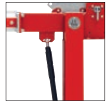
▲ Detail: Gasdruckfeder