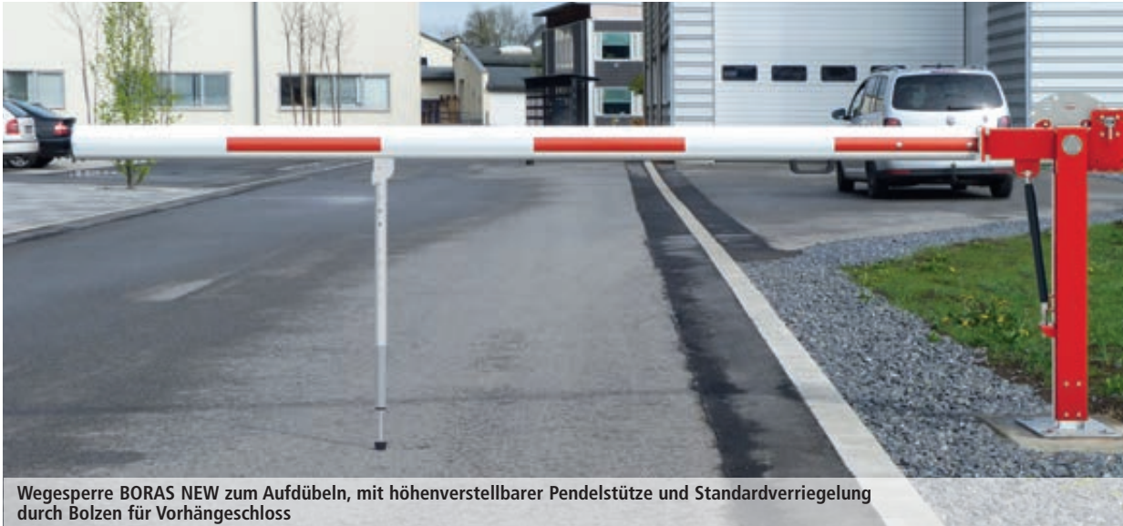
Wegesperre BORAS NEW zum Aufdübeln, mit höhenverstellbarer Pendelstütze und Standardverriegelung durch Bolzen für Vorhängeschloss