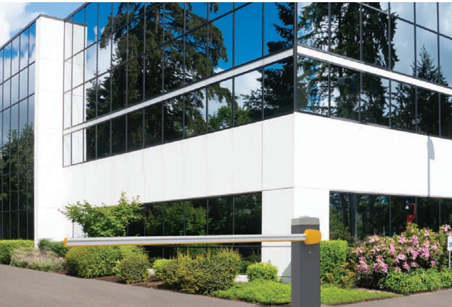
Schrankenanlage VANNES, Komplett-Set, Absperrbreite 2,80 m, ovaler Schrankenbaum, mit Blinkleuchte (Zubehör)