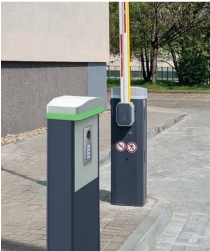
Gehäuse ARLES im Schrankendesign für Unterbringung von diversen Bedienelementen, mit optionaler Beleuchtung.

Eine breite Auswahl an Bedienelementen und Zubehör finden Sie auf den Seiten 562 - 563.