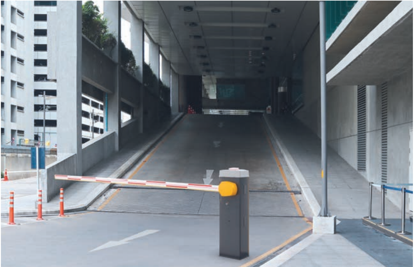
Schrankenanlage VANNES, Komplett-Set, Absperrbreite 2,80 m, ovaler Schrankenbaum, mit LED-Schrankenbaumbeleuchtung und LED-Blinkleuchte (Zubehör)

Eine breite Auswahl an Bedienelementen und Zubehör finden Sie auf den Seiten 562 - 563.