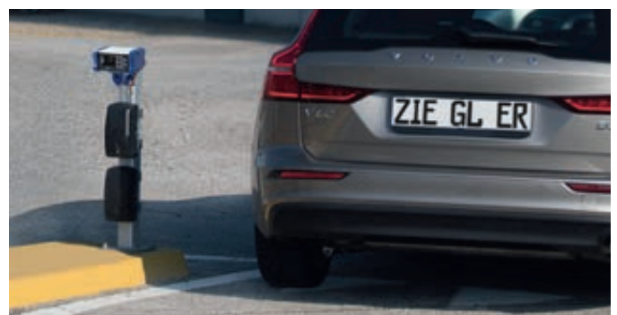
Kennzeichenerkennung ENNA mit integrierten Kameras kann als Standalone, mit lokalem Server oder über Cloudverwaltung eingesetzt werden.