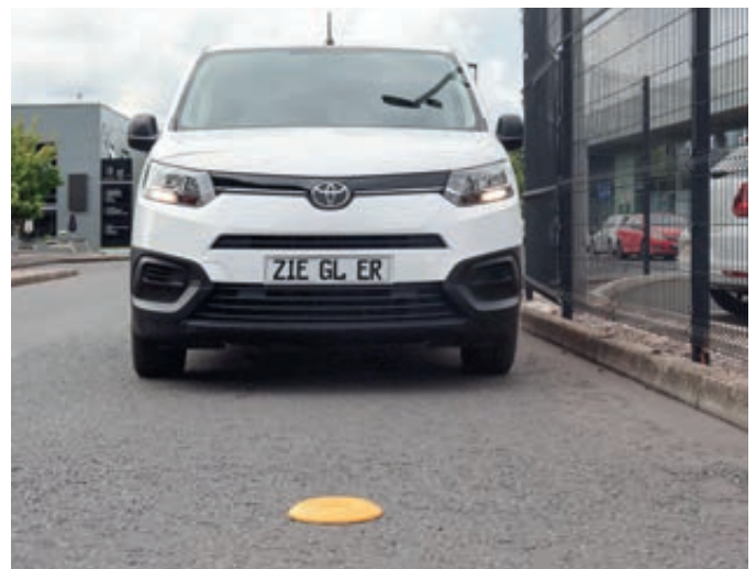
Fahrzeugerkennungssensor DIGNE für induktive Fahrzeugerkennung, kombiniert mit Präsenz-Erkennung über Radar.