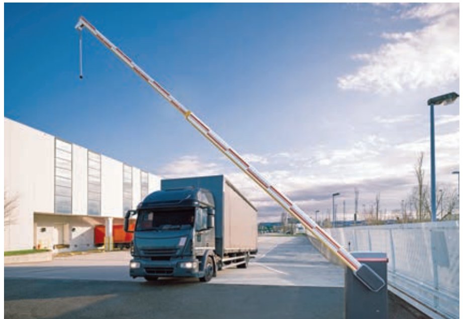
Schrankenanlage BUSSET, Absperrbreite 7,60 m mit 4 + 4 m Teleskop-Schrankenbaum mit Pendelstütze, mit LED-Schrankenbaumbeleuchtung (Zubehör)

Zubehör und Bedienelemente finden Sie auf den Seiten 562 - 563.