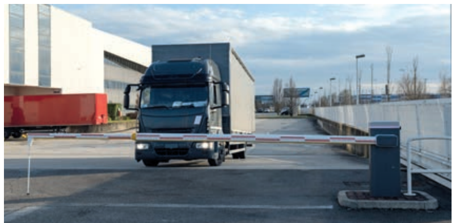
Schrankenanlage BUSSET, Absperrbreite 7,60 m mit 4 + 4 m Teleskop-Schrankenbaum mit Pendelstütze, mit LED-Schrankenbaumbeleuchtung (Zubehör)