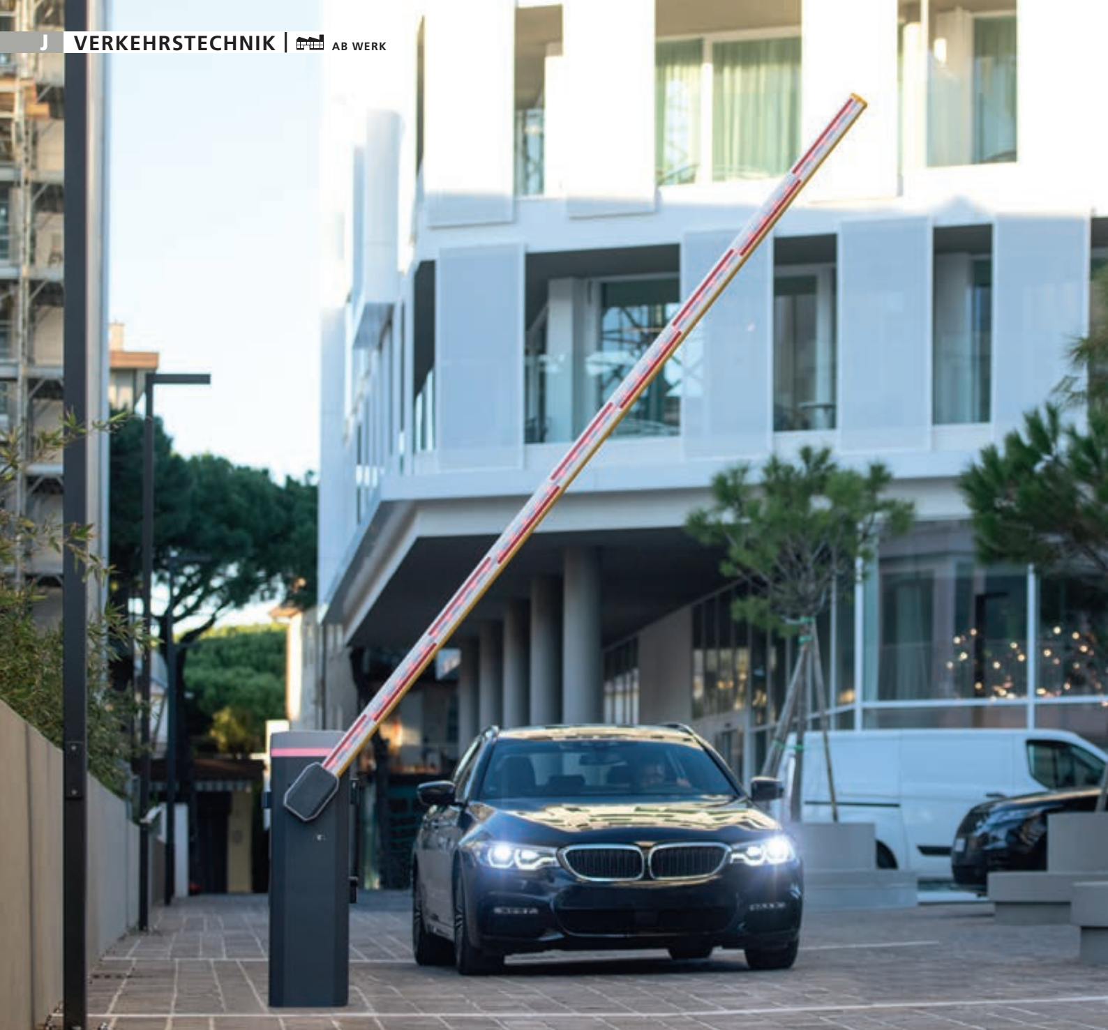
Schrankenanlage BUSSET, Absperrbreite 4,00 m, mit LED-Schrankenbaumbeleuchtung (Zubehör)