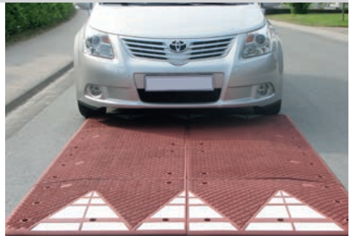
Euronormkissen NONZA, 8-teilig, in rotbraun

Elastikbordsteine, Kreisverkehre und Verkehrsinseln finden Sie online unter: www.ziegler-metall.at