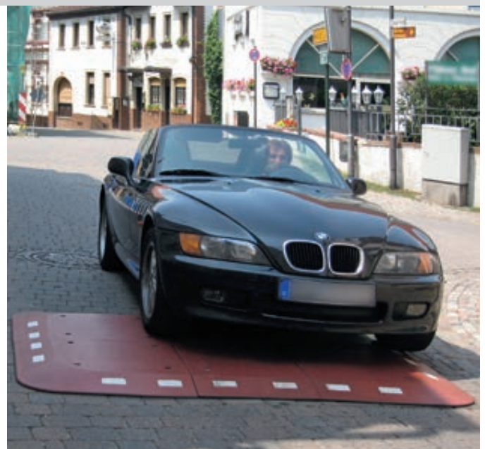
Temposchwelle BERLINER KISSEN, 6-teilig, in rotbraun