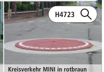
Kreisverkehr MINI in rotbraun