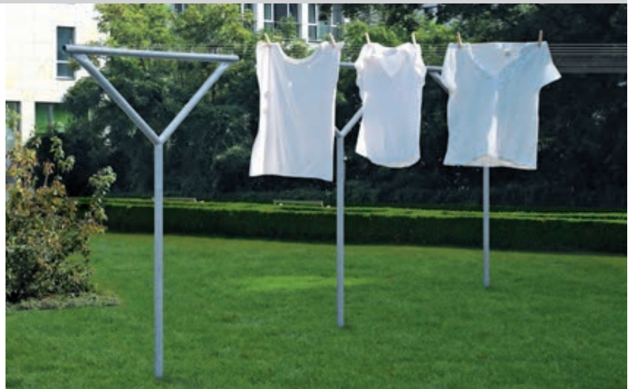
Wäschegerüst MAUBEC, feuerverzinkt