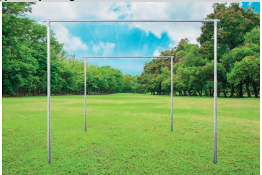
Gerüst mit Wäschestange NAJAK, feuerverzinkt

Standardfarben für Wäschegerüst MAUBEC und Gerüst mit Wäsche- bzw. Teppichklopfstange NAJAK - bitte bei Bestellung Farbe angeben!