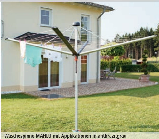
Wäschespinne MAHLU mit Applikationen in anthrazitgrau