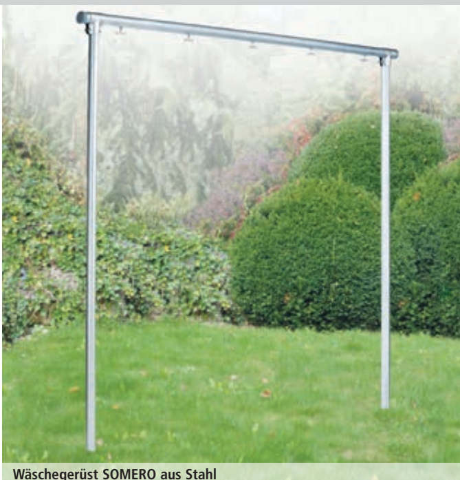
Wäschegerüst SOMERO aus Stahl