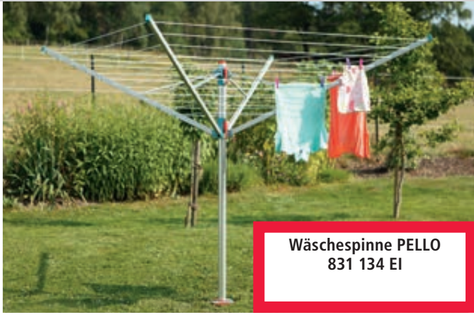
Wäschespinne PELLO 831 134 EI