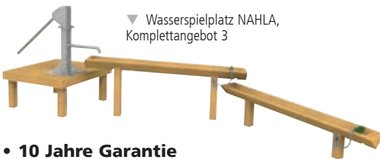
▼ Wasserspielplatz NAHLA, Komplettangebot 3