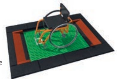
► Bodentrampolin RANDI, Umrandung in schwarz sowie rot-braun, Sprungmatte ähnlich RAL 6029 minzgrün