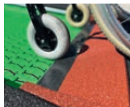
► Detail: Rampe