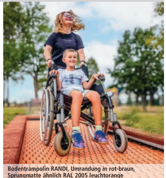
Bodentrampolin RANDI, Umrandung in rot-braun, Sprungmatte ähnlich RAL 2005 leuchtorange