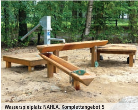
Wasserspielplatz NAHLA, Komplettangebot 5

Weitere Varianten finden Sie online: www.ziegler-metall.at