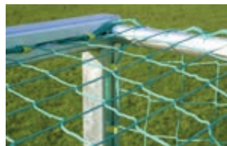
▲ Netz grün, 3 mm stark, Polypropylen