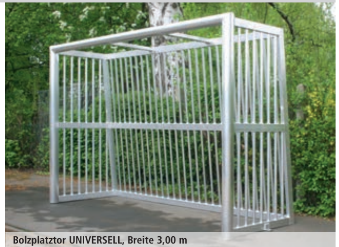
Bolzplatztor UNIVERSELL, Breite 3,00 m