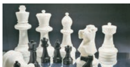
◀ Spielfiguren-Set SCHACH, klein und groß