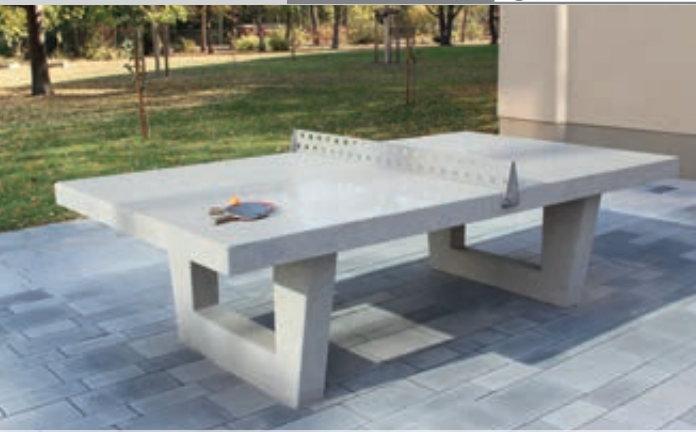
Tischtennisplatte POKE mit offenen Füßen, im Turniermaß