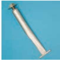
▲ Zubehör: Bodenverankerung für Hartplätze