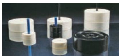
◀ Spielfiguren-Set DAME, klein und groß

Ein Set bestehend aus 16 weißen und 16 schwarzen Spielfiguren.