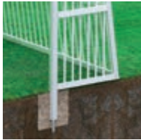
▲ Zubehör: Pfostenverlängerung