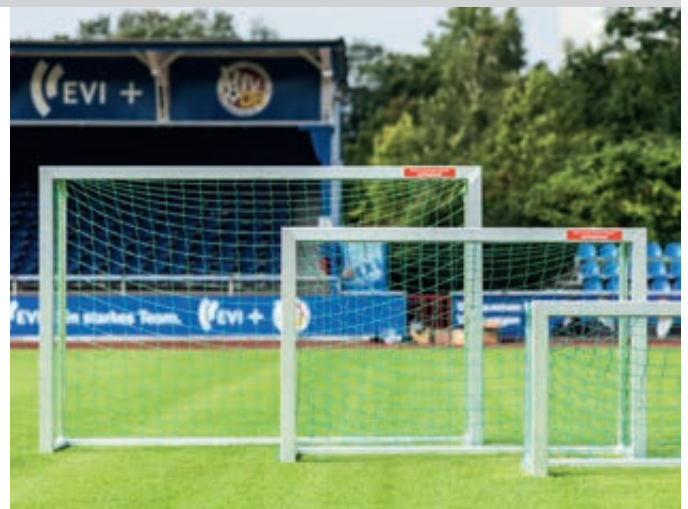
Minitor-Streetball MONTREAL, Breite 2,40 m, 1,80 m und 1,20 m, mit Netz (Zubehör)