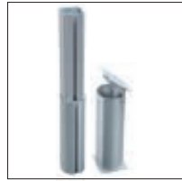
▲ Zubehör: Adapterkonstruktion bestehend aus Adapter und Bodenhülse mit Deckel