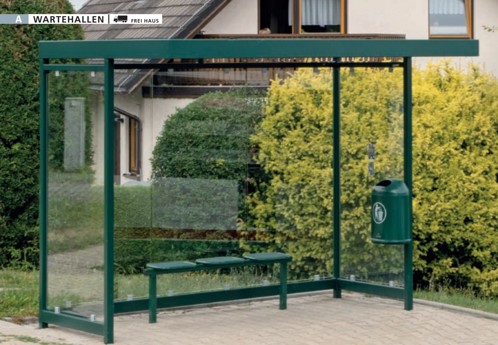
Wartehalle AQUILA, Dachbreite x Dachtiefe 3180 mm x 2165 mm, zum Aufdübeln bei -200 mm, mit Rück- / Seitenwänden, mit Abfallsammler DERBY sowie Sitzbank TARVIS, Stahlkonstruktion in RAL 6005 moosgrün