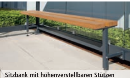
Sitzbank mit höhenverstellbaren Stützen