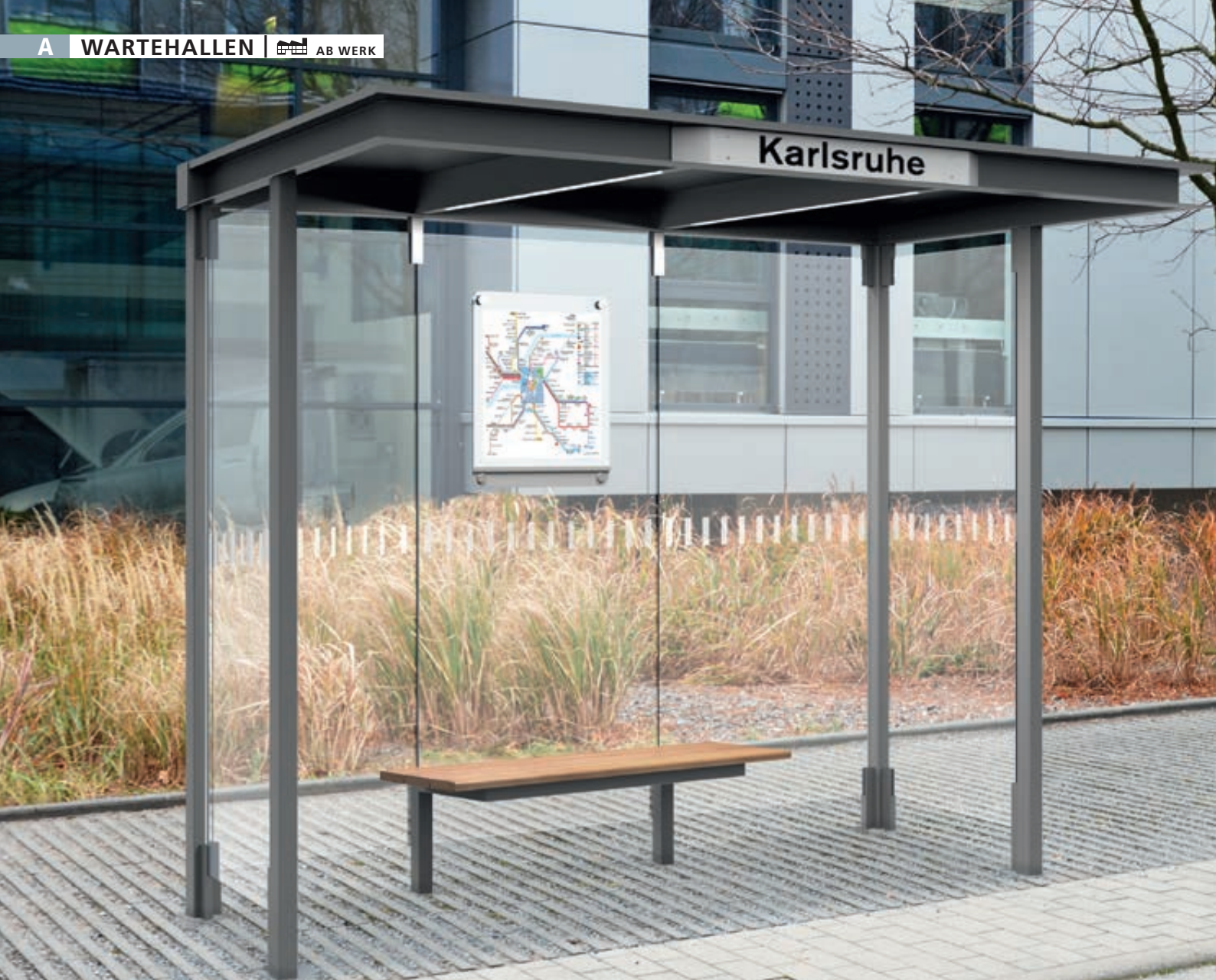
Wartehalle HOREC, Dachbreite x Dachtiefe 2955 mm x 1484 mm, mit Rück- und Seitenwänden Verbundsicherheitsglas (VSG), mit Sichtstreifen, Sitzbank mittig, Fahrplanschaukasten und LED-Beleuchtung, Stationsschild auftragsbezogene Anpassung in RAL 9016 verkehrsweis, Stahlkonstruktion in RAL 9007 graualuminium