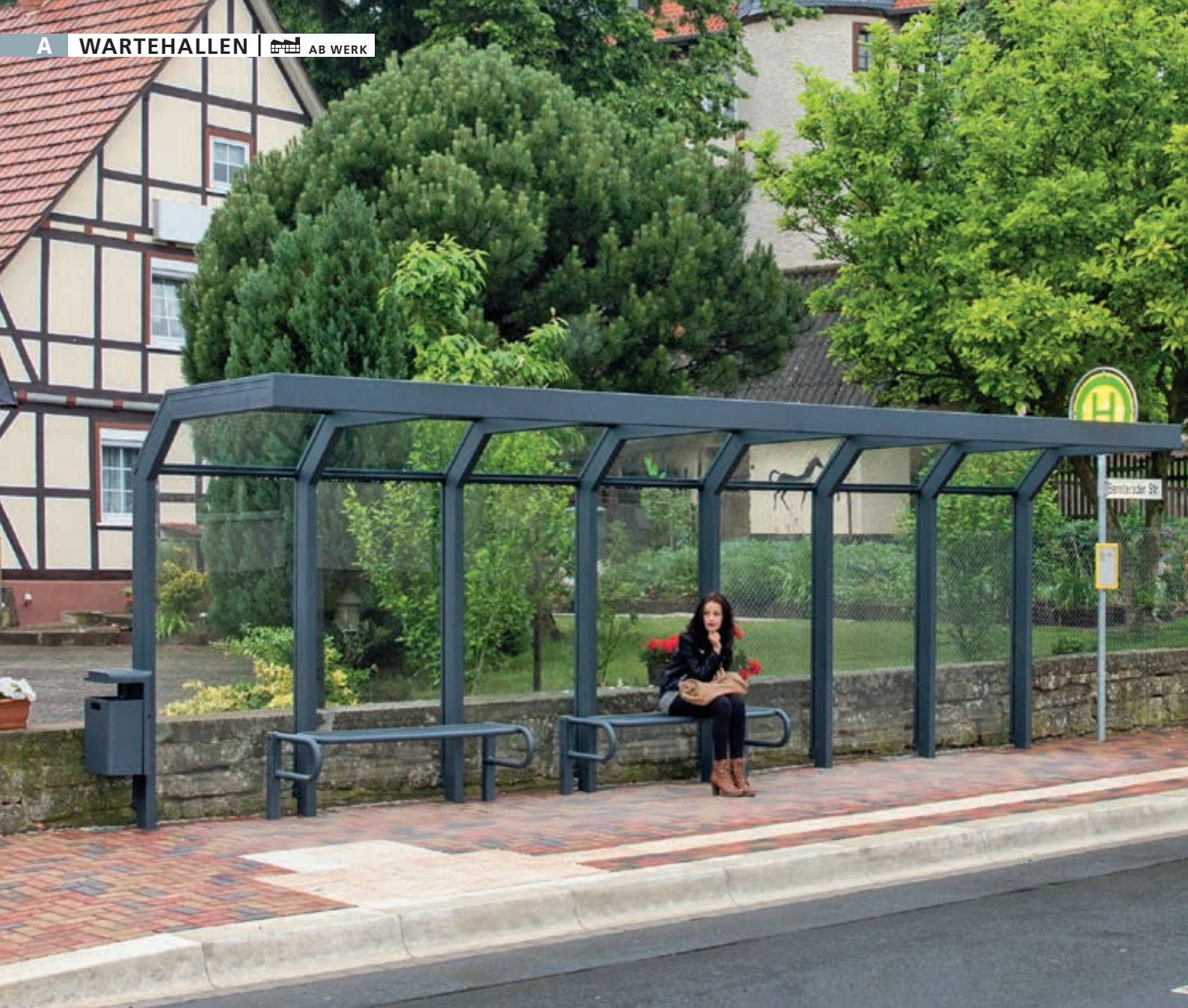
Wartehalle SATURN, auftragsbezogene Anpassung der Dachbreite x Dachtiefe 7060 mm x 1600 mm, inkl. Rückwände ESG, Klarglas, Sitzbänke SESTO und Abfallbehälter HALIFAX, Stahlkonstruktion in RAL 7016 anthrazitgrau