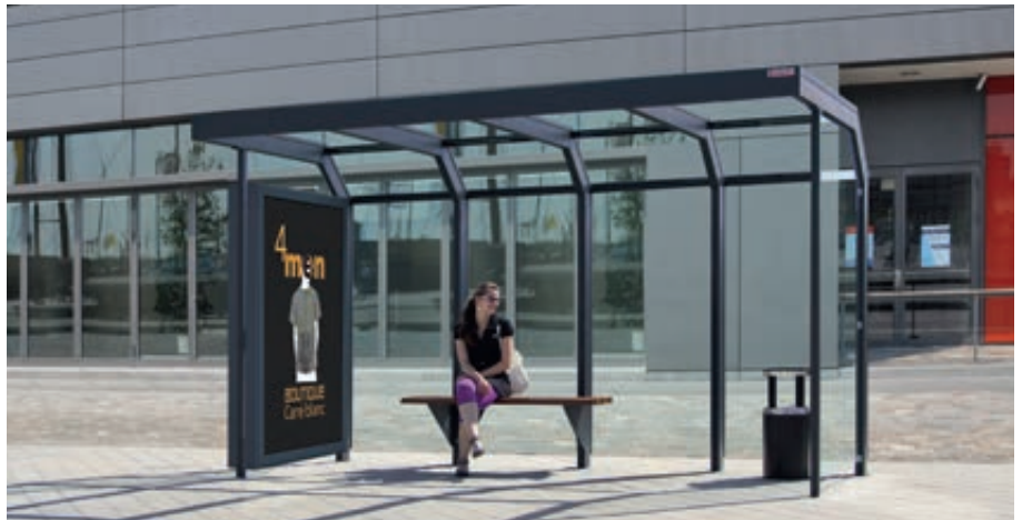
Wartehalle SATURN, Dachbreite x Dachtiefe 4060 mm x 2000 mm, mit Seitenwand, doppelseitiger Werbevitrine CITY-LIGHT, Sitzbank ARES und Abfallbehälter CALGARY, Stahlkonstruktion in RAL 7016 anthrazitgrau

Preis ohne Zubehör (Sitzbank), zuzüglich Fracht & Montage.