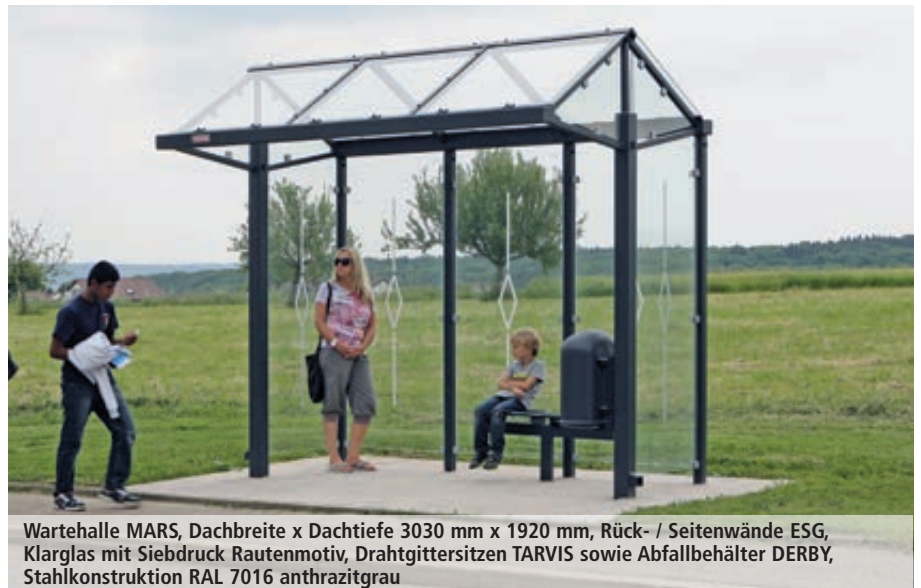
Wartehalle MARS, Dachbreite x Dachtiefe 3030 mm x 1920 mm, Rück- / Seitenwände ESG, Klarglas mit Siebdruck Rautenmotiv, Drahtgittersitzen TARVIS sowie Abfallbehälter DERBY, Stahlkonstruktion RAL 7016 anthrazitgrau