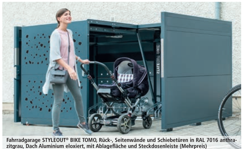
Fahrradgarage STYLEOUT® BIKE TOMO, Rück-, Seitenwände und Schiebetüren in RAL 7016 anthrazitgrau, Dach Aluminium eloxiert, mit Ablagefläche und Steckdosenleiste (Mehrpreis)