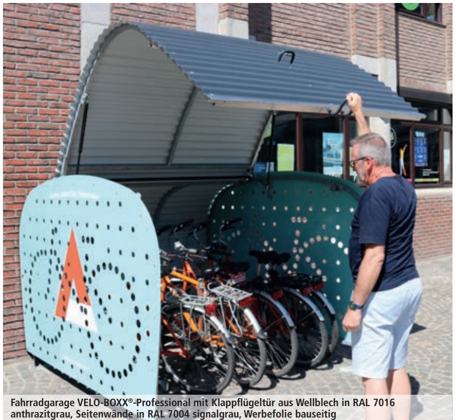
Fahrradgarage VELO-BOXX®-Professional mit Klappflügeltür aus Wellblech in RAL 7016 anthrazitgrau, Seitenwände in RAL 7004 signalgrau, Werbefolie bauseitig