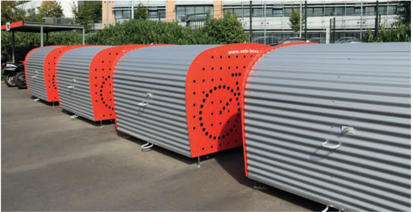
Fahrradgarage VELO-BOXX®-Professional mit Klappflügeltür aus Wellblech in RAL 9007 graualuminium, Seitenwände in RAL 3000 feuerrot (auftragsbezogene Pulverbeschichtung)

Weitere Bilder, Informationen und Ausschreibungstexte: www.ziegler-metall.de