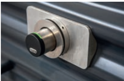
▲ Detail: Elektronisches Schließsystem