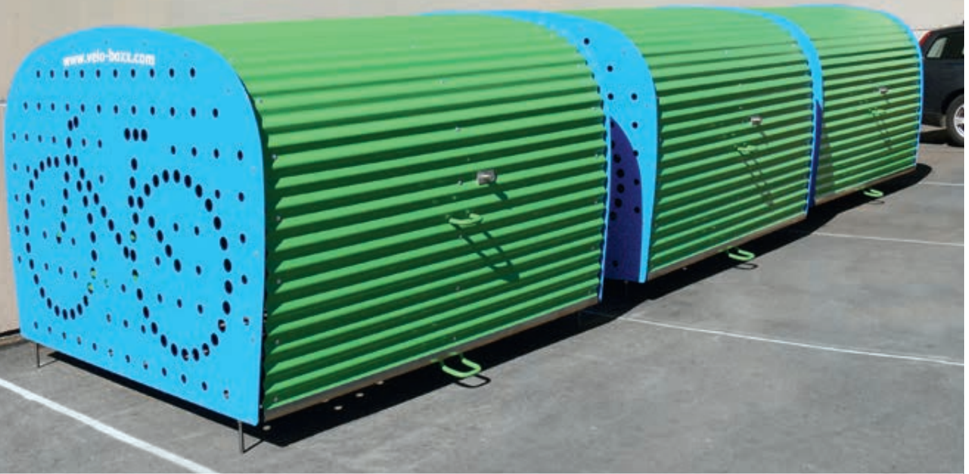
Fahrradgarage VELO-BOXX®-Professional mit Klappflügeltür aus Wellblech in RAL 6018 gelbgrün, Seitenwände in RAL 5012 lichtblau (auftragsbezogene Pulverbeschichtung)