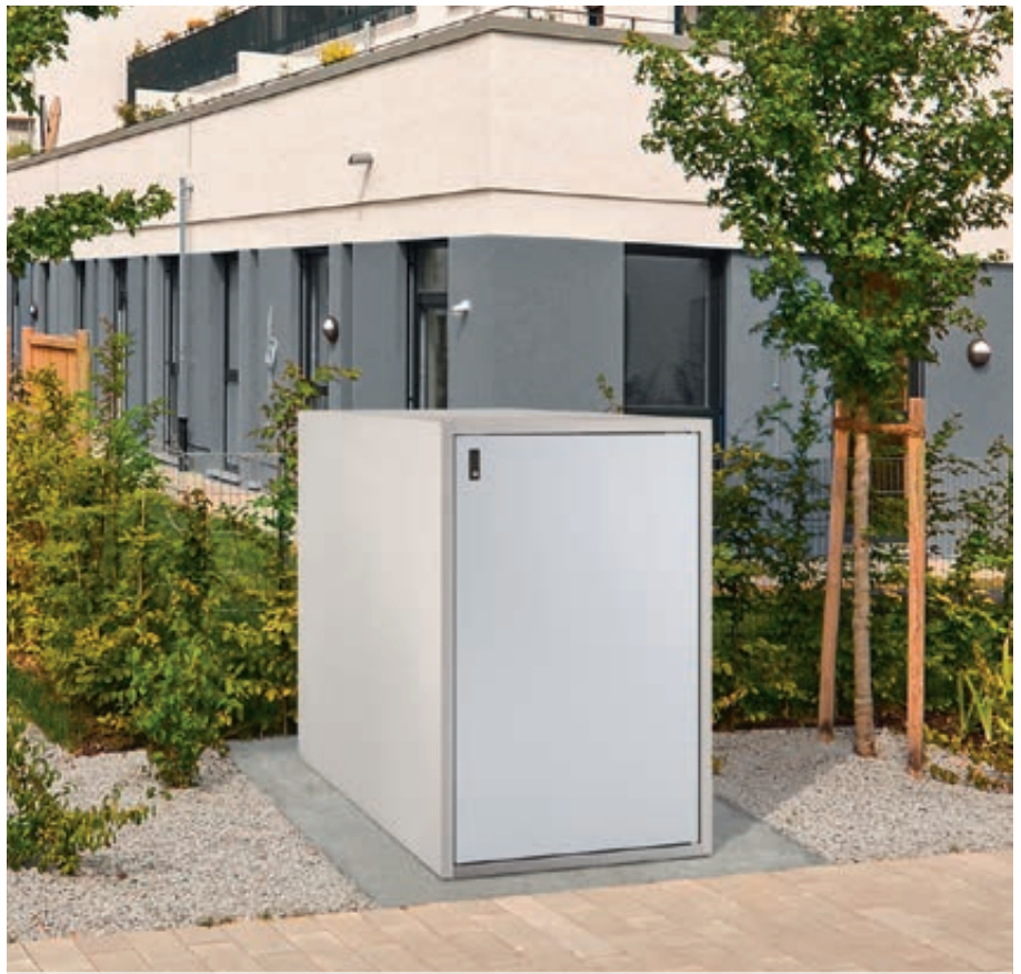
Fahrradgarage ARLINGTON, Korpus Sichtbeton glatt, basisgrau, Türblatt RAL 7035 lichtgrau

Weitere Bilder, Informationen und Ausschreibungstexte: www.ziegler-metall.de