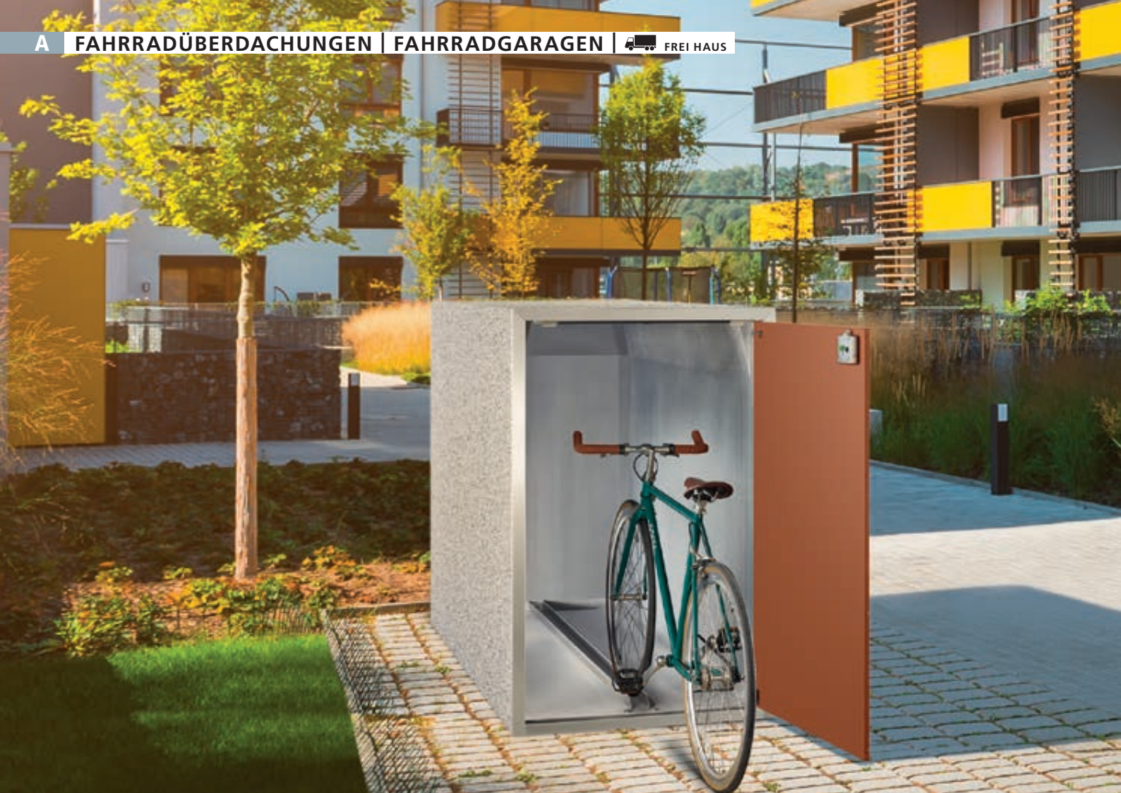
Fahrradgarage ARLINGTON, Korpus Sichtbeton gewaschen, perlgrau, Türblatt RAL 8002 signalbraun, Führungsschiene, Kastenschloss mit Notentriegelung von innen